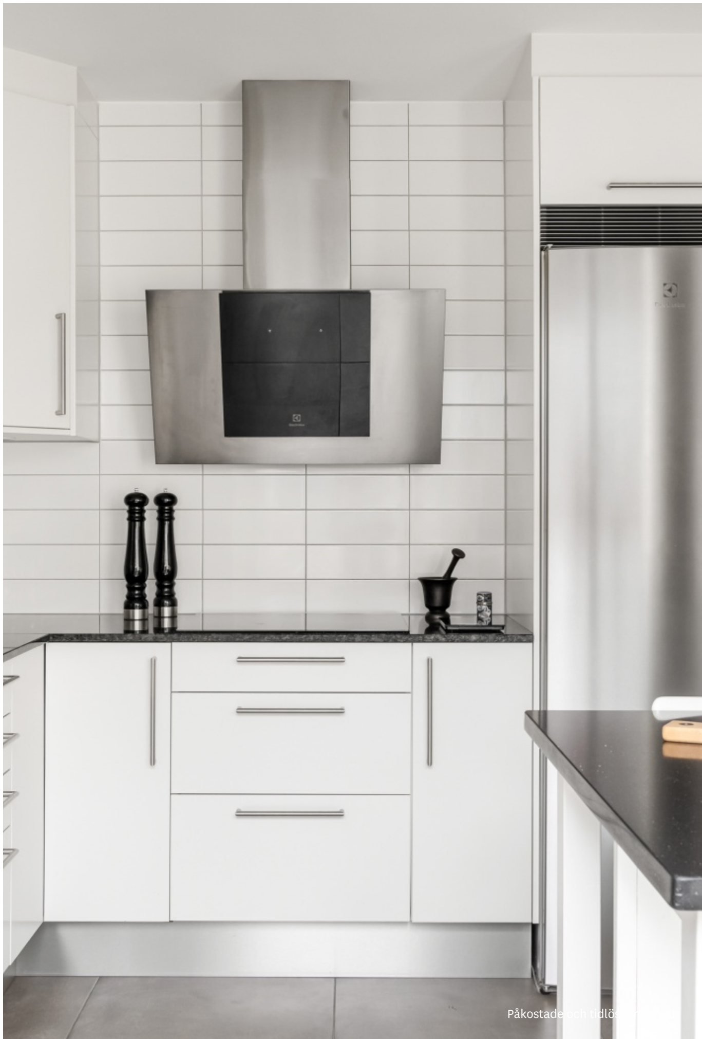
Påkostade och tidlösa