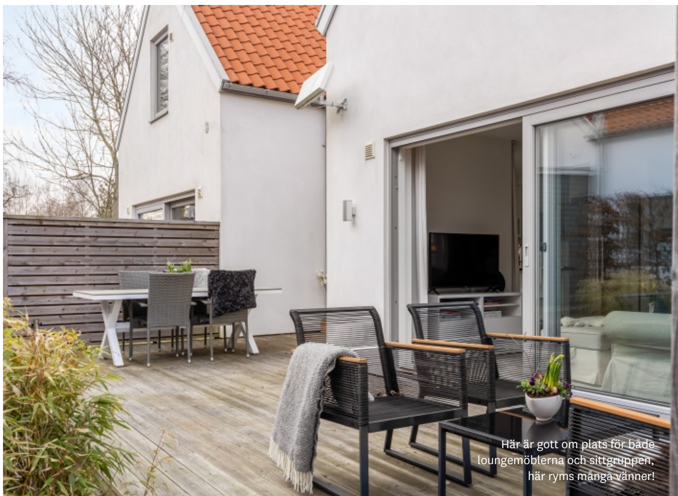
Här är gott om plats för både loungemöblerna och sittgruppen, här ryms många vänner!