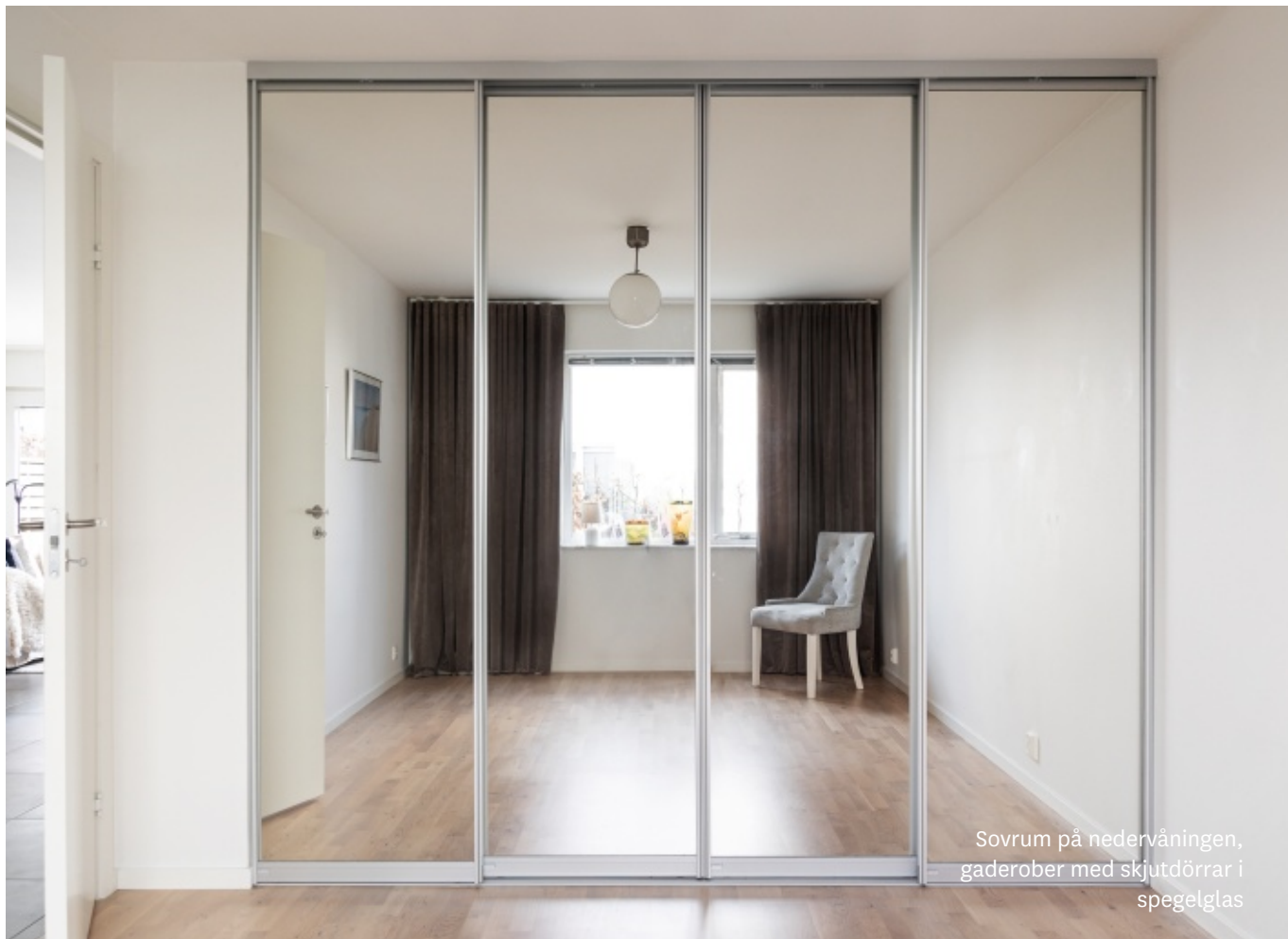
Sovrum på nedervåningen, gaderober med skjutdörrar i spegelglas