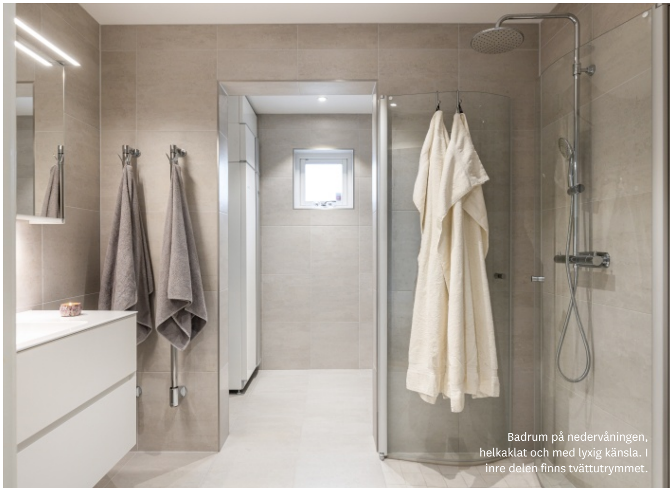
Badrum på nedervåningen, helkaklat och med lyxig känsla. I inre delen finns tvättutrymmet.