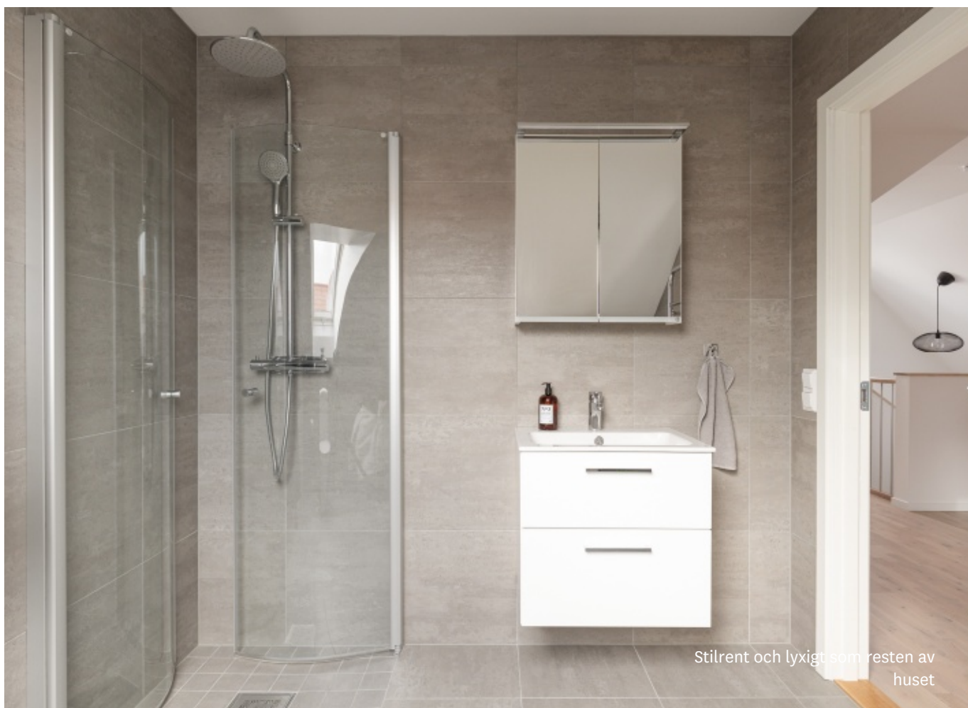
Stilrent och lyxigt som resten av huset