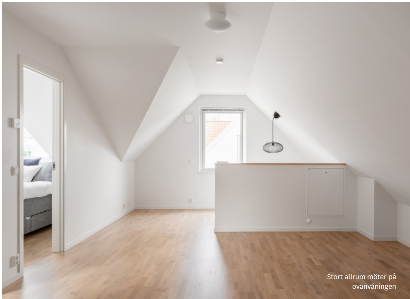
Stort allrum möter på ovanvåningen