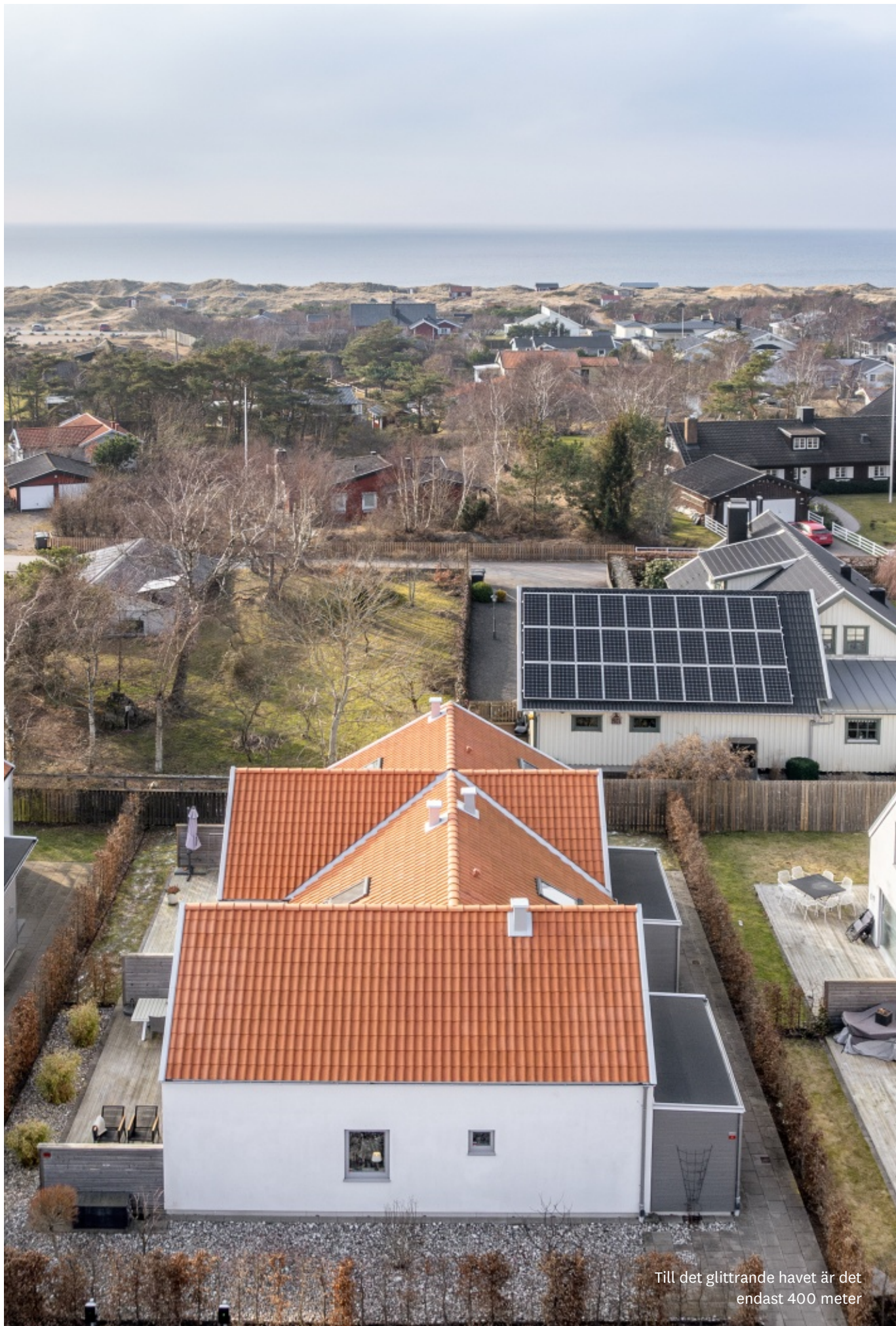
Till det glittrande havet är det endast 400 meter