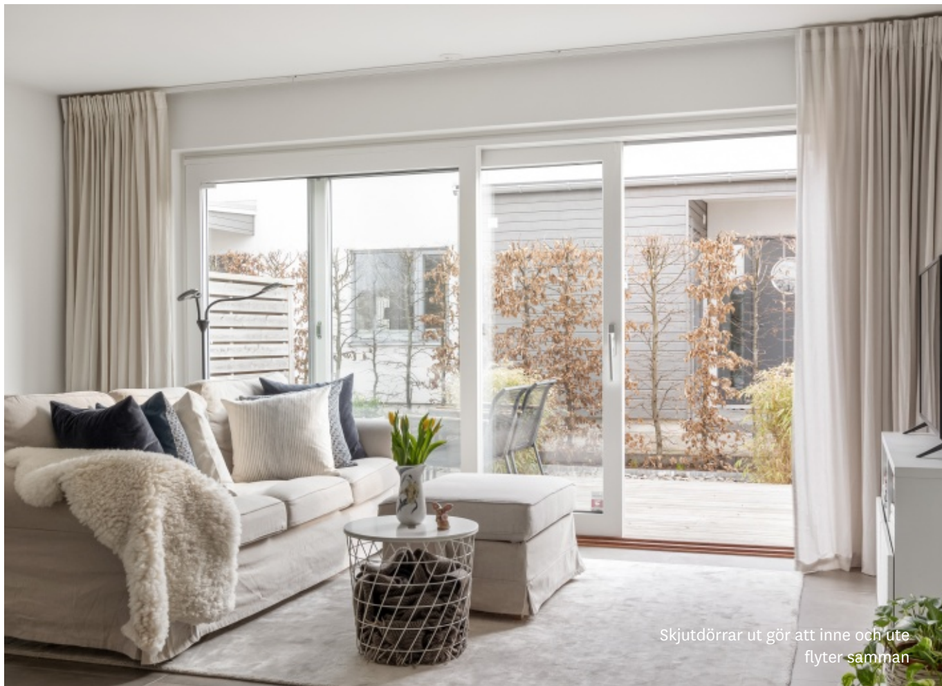
Skjutdörrar ut gör att inne och ute flyter samman