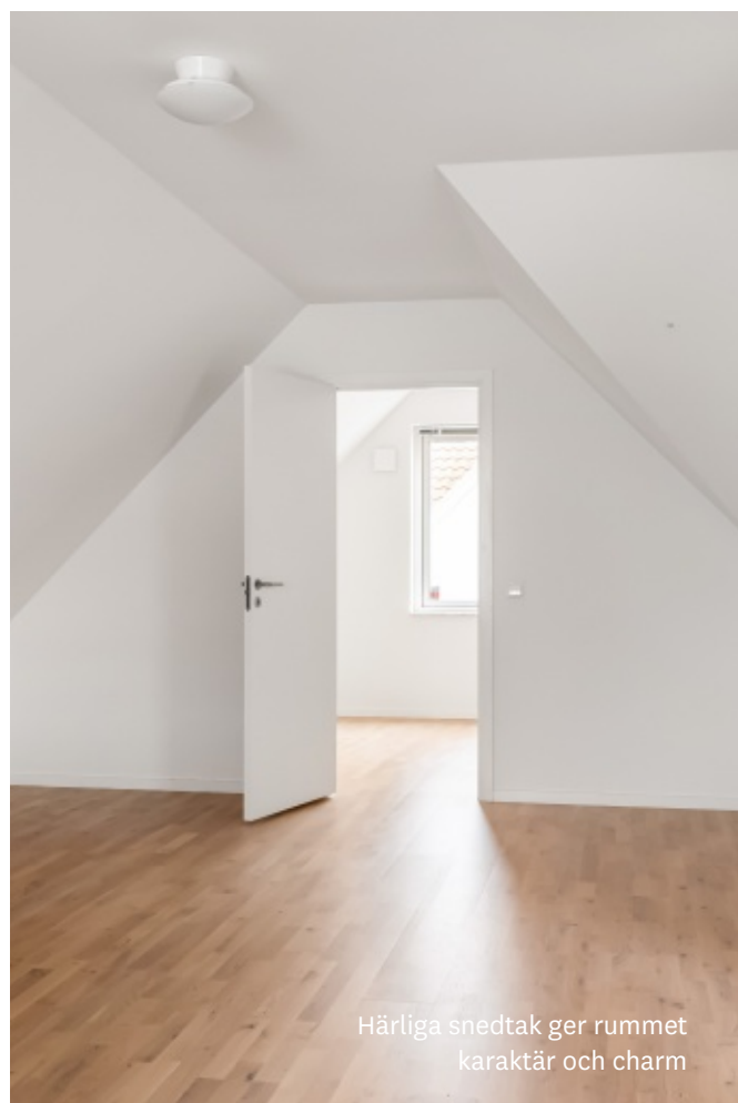
Härliga snedtak ger rummet karaktär och charm