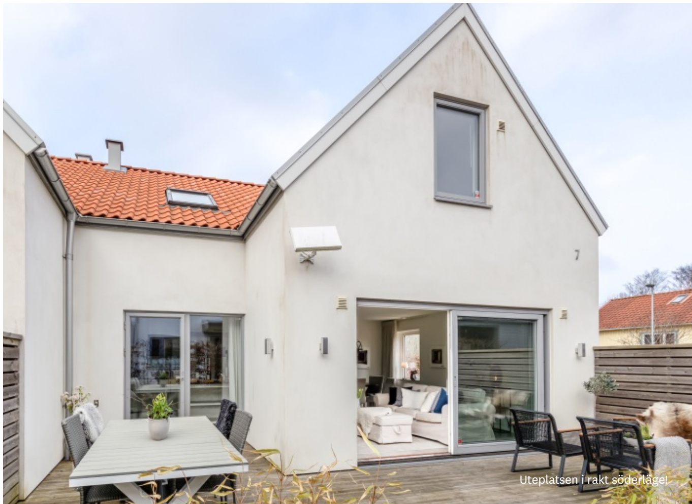
Uteplatsen i rakt söderläge!