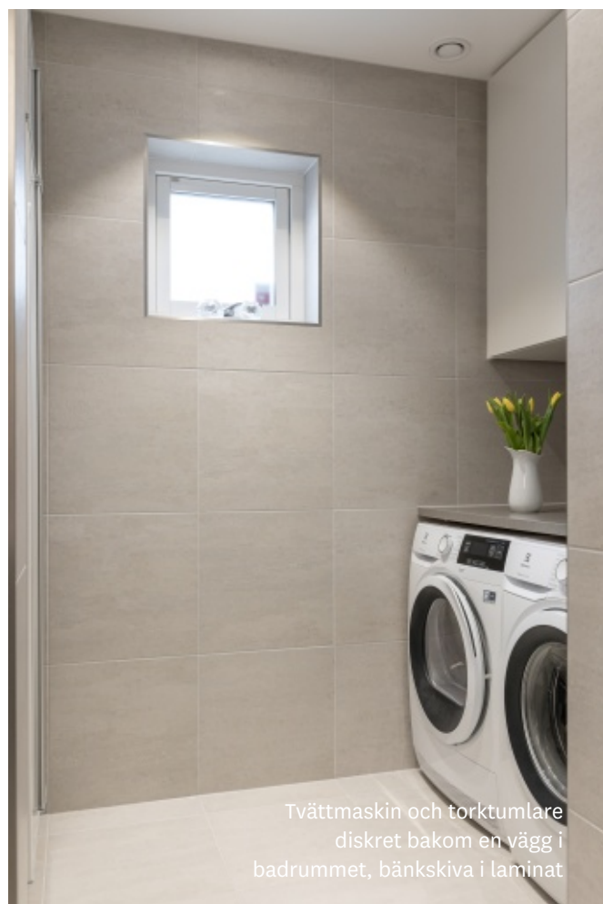
Tvättmaskin och torktumlare diskret bakom en vägg i badrummet, bänkskiva i laminat