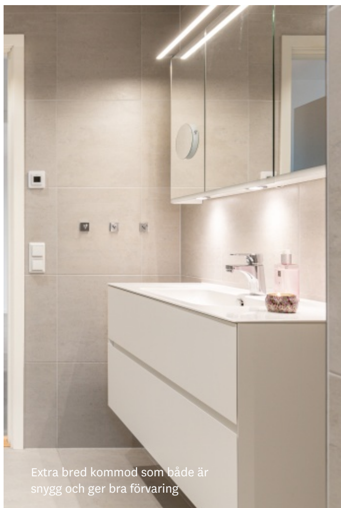
Extra bred kommod som både är snygg och ger bra förvaring