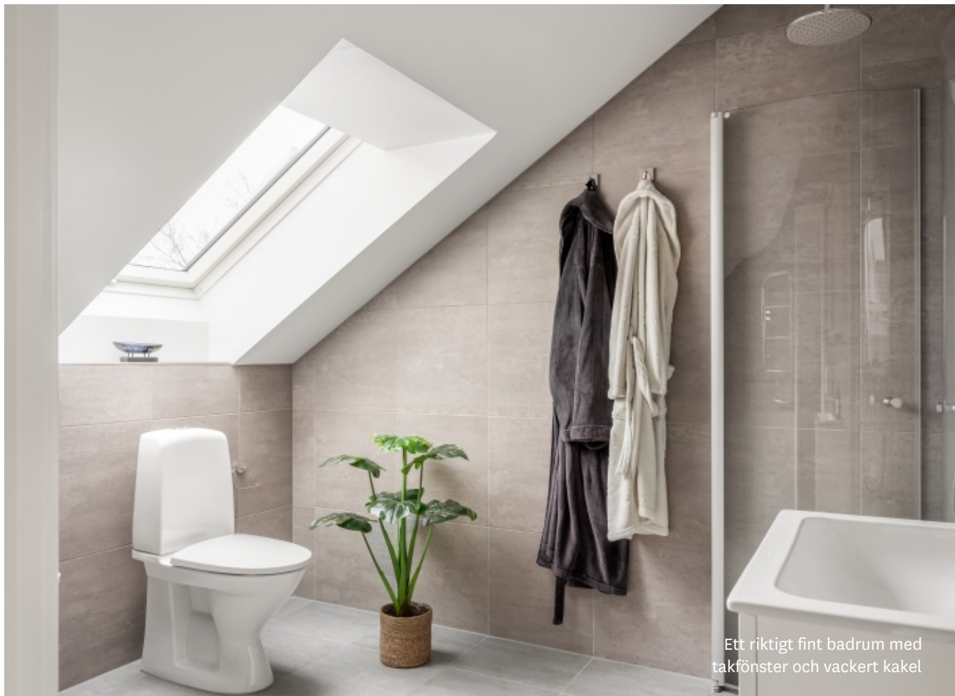
Ett riktigt fint badrum med takfönster och vackert kakel