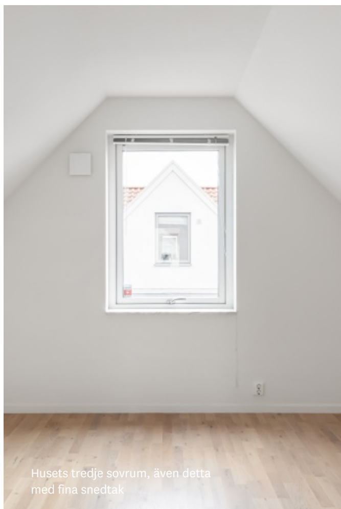
Husets tredje sovrum, även detta med fina snedtak