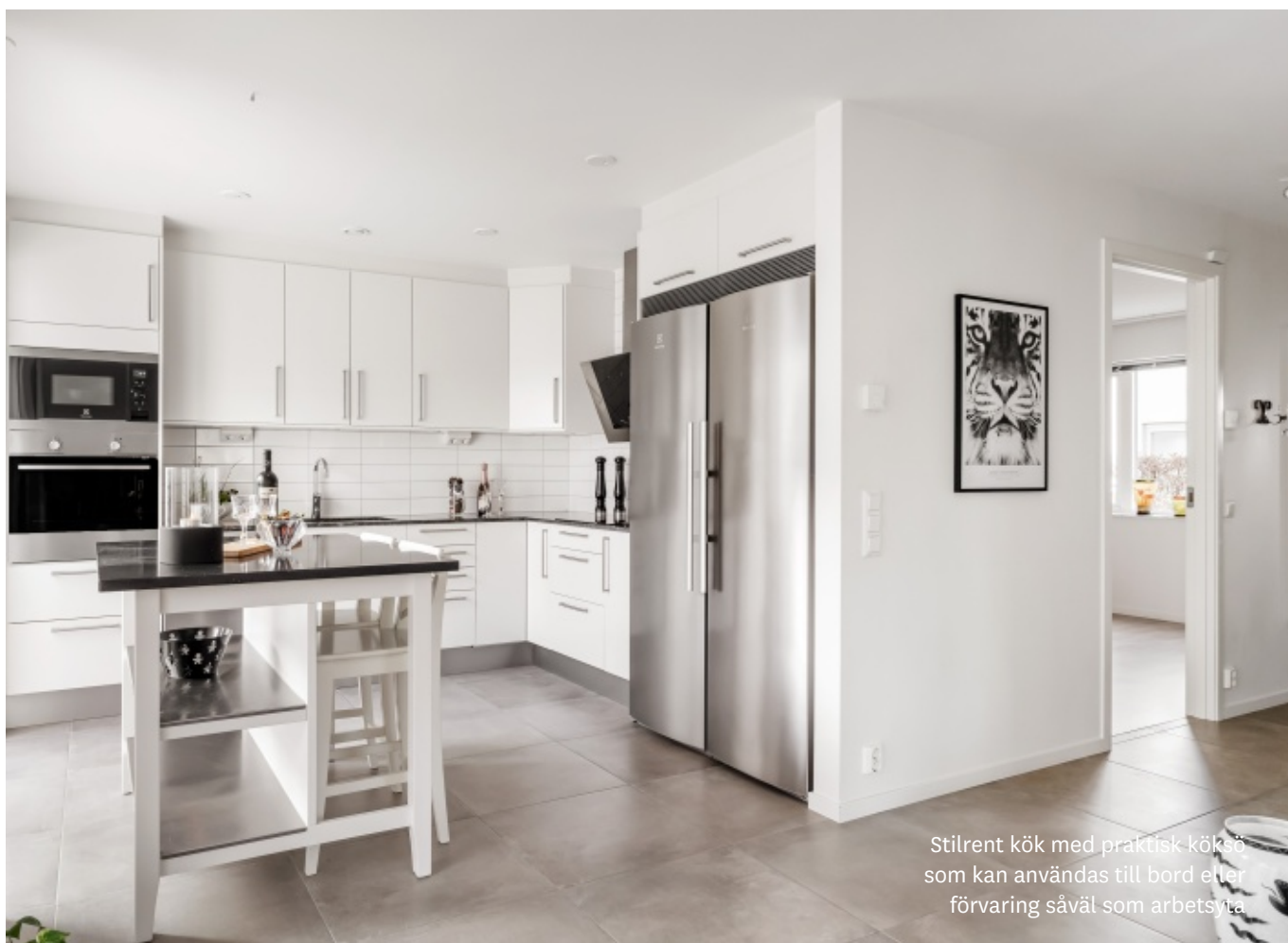
Stilrent kök med praktisk köksö som kan användas till bord eller förvaring såväl som arbetsyta