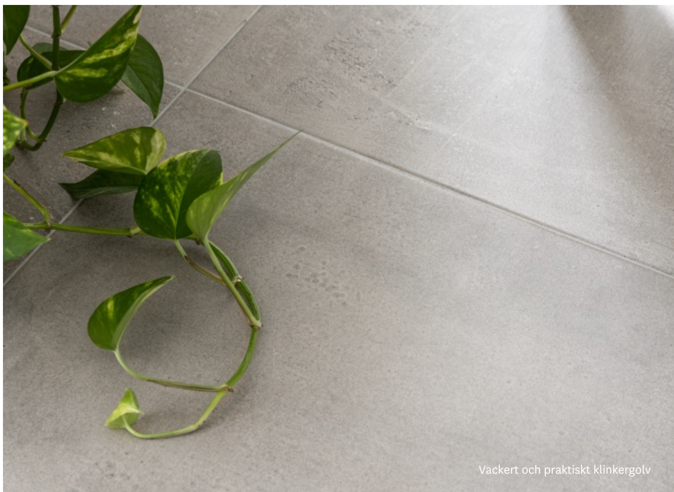
Vackert och praktiskt klinkergolv