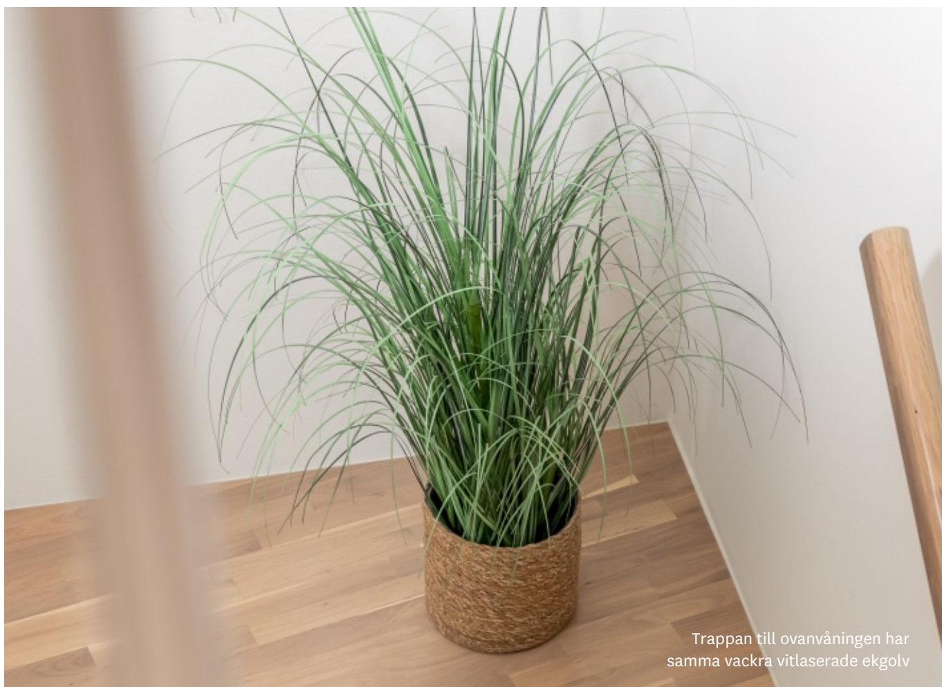
Trappan till ovanvåningen har samma vackra vitlaserade ekgolv