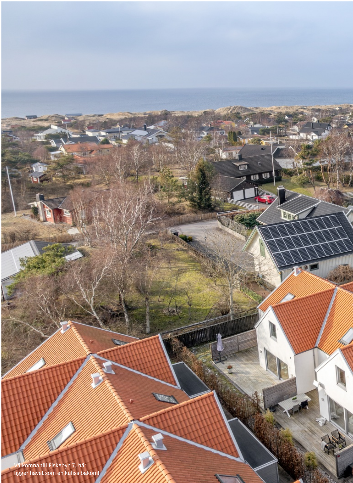
Välkomna till Fiskebyn 7, här ligger havet som en kuliss bakom!