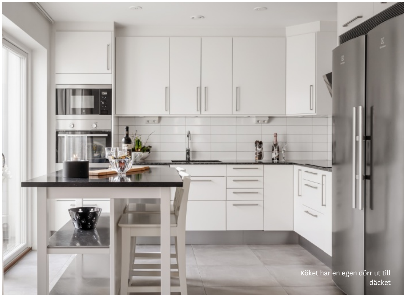
Köket har en egen dörr ut till däck