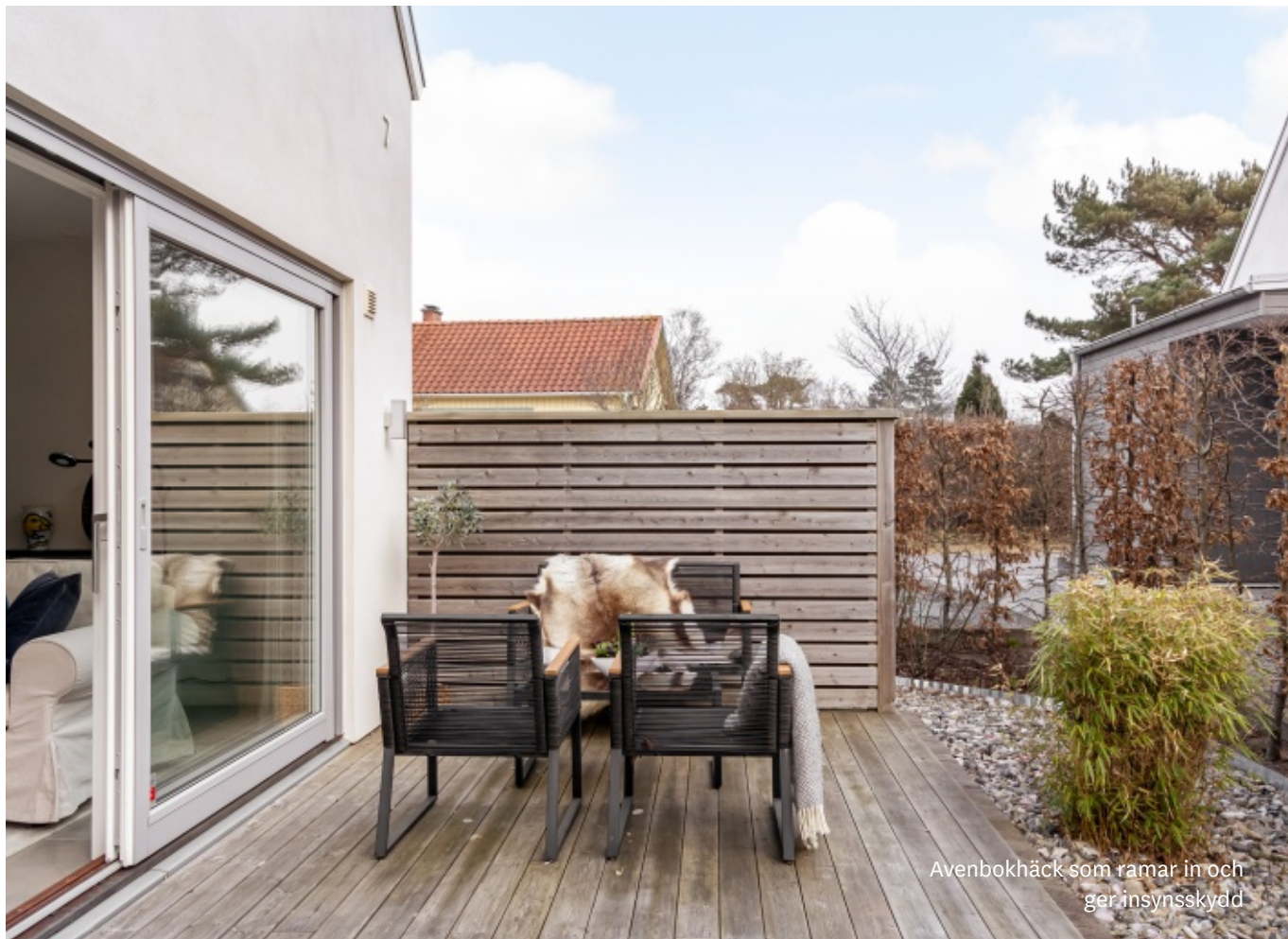
Avenbokhäck som ramar in och ger insynsskydd