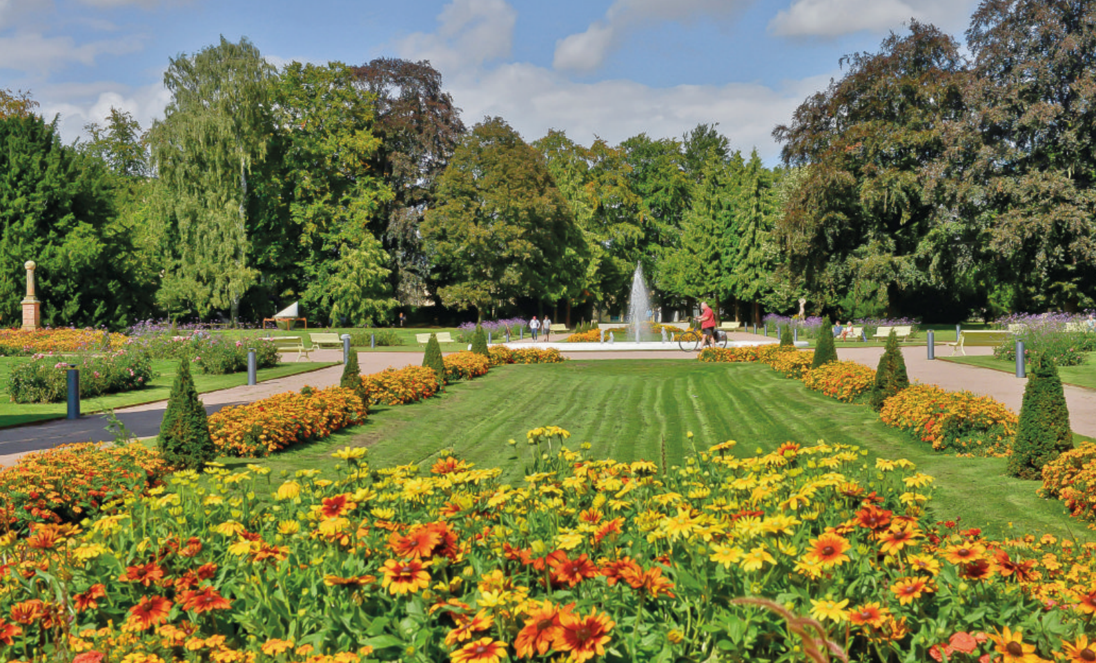
OVAN. LUND PRÄGLAS AV GRÖNA OMRÅDEN, PERFEKTA FÖR REKREATION OCH AVKOPPLING NEDAN. INBJUDANDE ARKITEKTUR I CENTRALA LUND