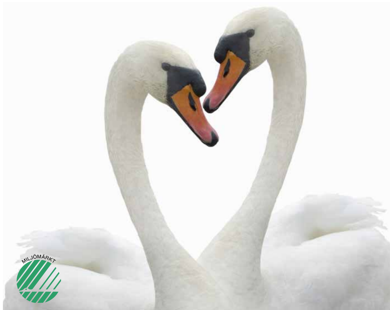
Bilderna i denna broschyr är digitala montage. Reservation för ändringar och ev tryckfel.

världsledande miljömärkning som ställer marknadens tuffaste miljö- och klimatkrav. Veidekke Bostad delar Svanens miljövärderingar och var först i Norden med att få ett flerbostadshus Svanenmärkt. En Svanenmärkt bostad är bra för allergiker och hälsosam för alla. När du väljer en Svanenmärkt bostad gör du en aktiv insats för klimatet bara genom att bo.