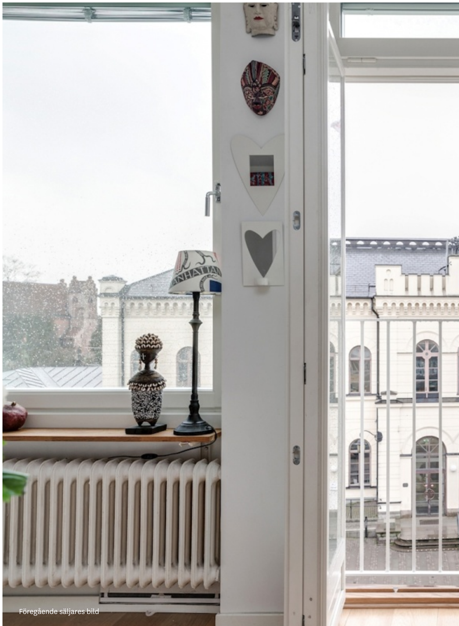
Föregående säljares bild