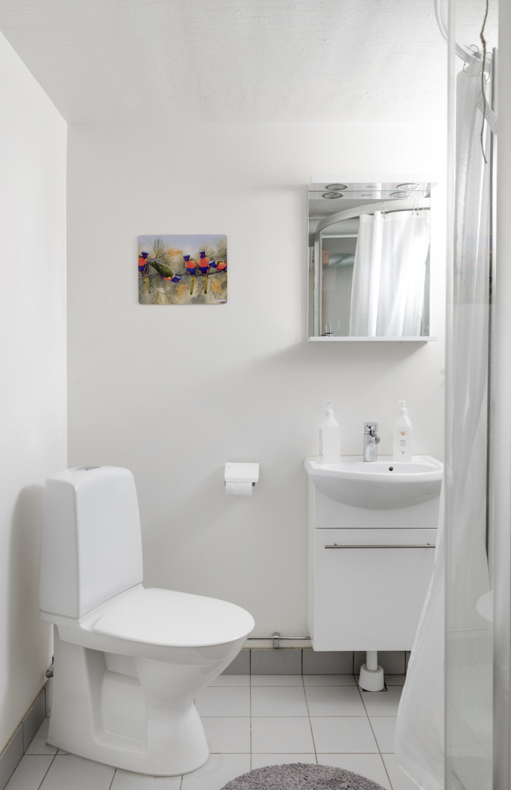
DENNA SIDA: FÖRENINGENS GÄSTLÄGENHET