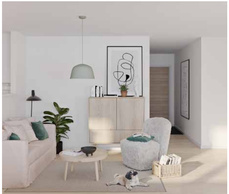
Ljus och öppen planlösning.

Gott om förvaring är någonting som ofta är efterfrågat i ett nytt hem – därför har vi satsat mycket på det i Kapellgärdet Arena IV.