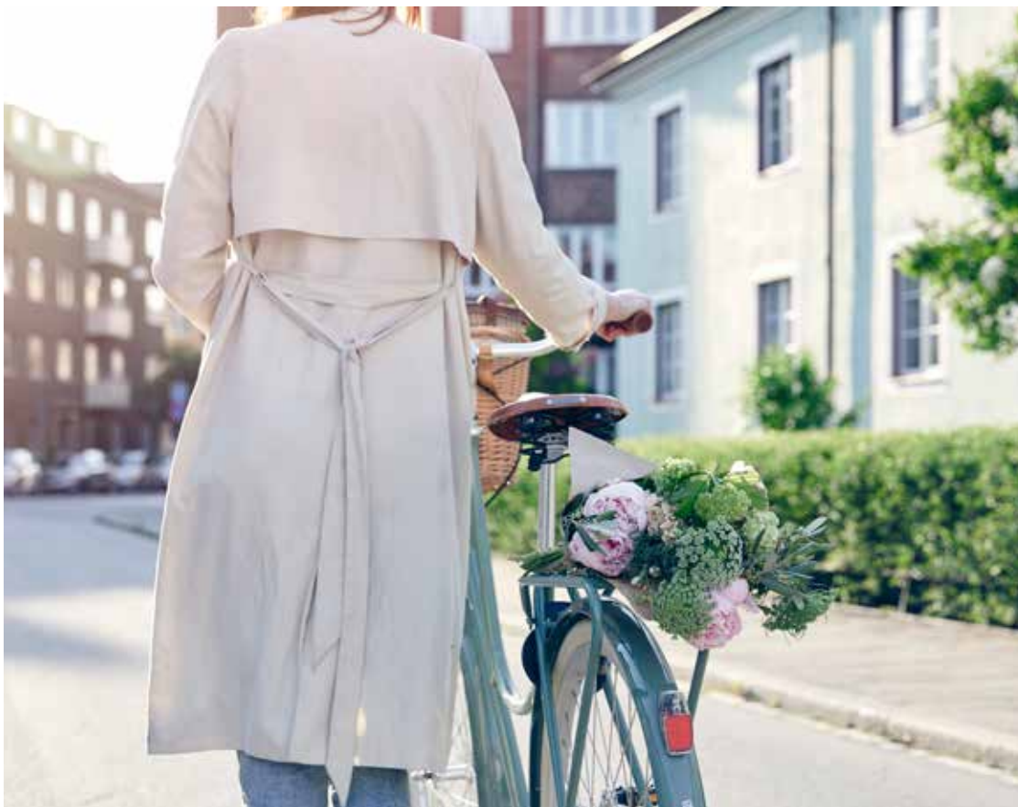
Närhet till naturen