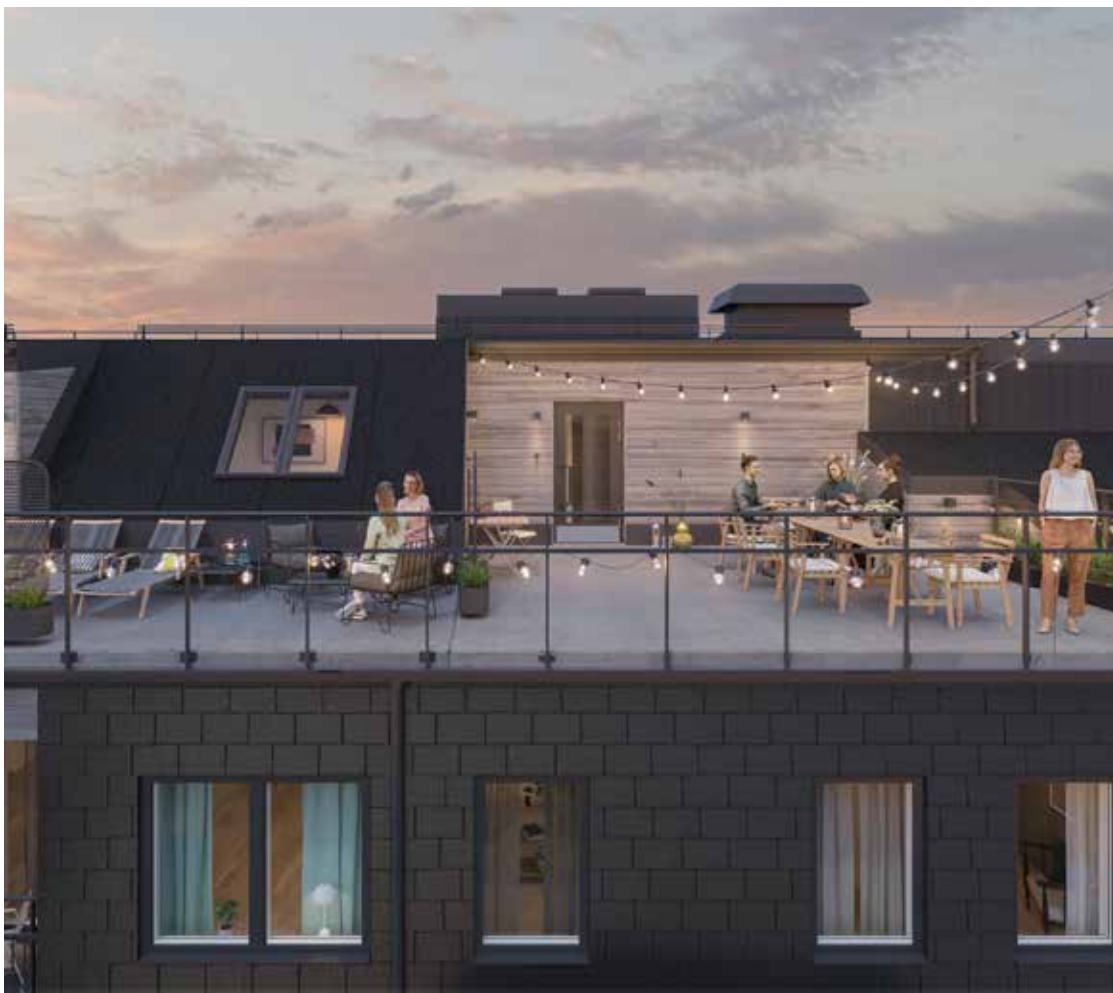
Middag på takterrassen