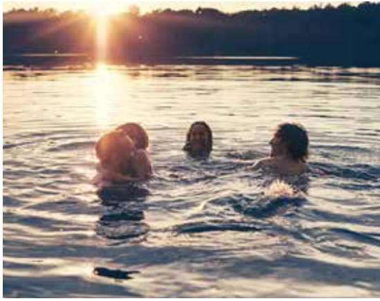
Hem nära naturen