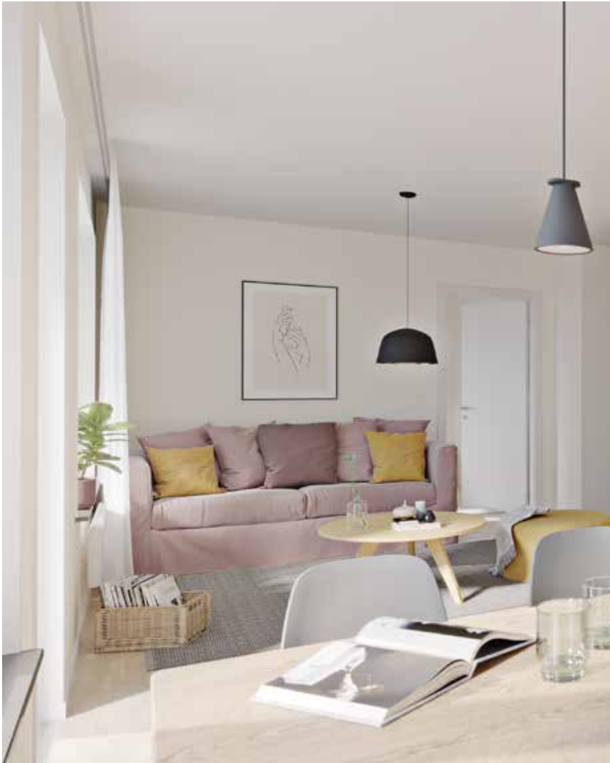
Vardagsrum med plats för både matbord och soffa.

Gott om förvaring är någonting som ofta är efterfrågat i ett nytt hem – därför har vi satsat mycket på det i Kapellgärdet Arena IV.