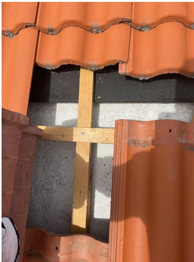
Cellplast under takpannor.