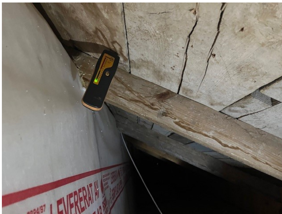
Fuktmätning i snedvind.