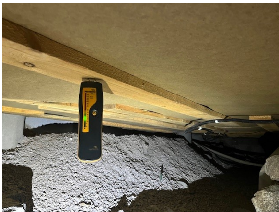
Fuktmätning i torpargunden/krypgrunden.

En enklare kondensavfuktare är installerad i utrymmet. Fuktkvoten uppmättes vid aktuell besiktning till 13-14 % i bjälklagets undersida. Kritiskt värde för mikrobiell växt (mögel/bakterier) är cirka 17 %.