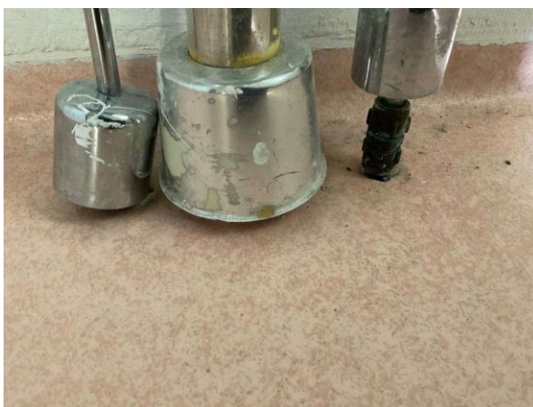
Bild 8: Invändigt, Entréplan, Duschrum wc, Det förekommer rörgenomföringar i golv annat än för av...