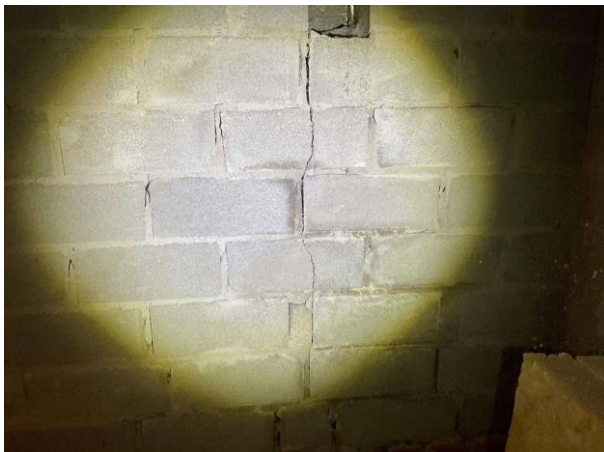
Bild 1: Utvändigt, Grund, Uteluftventilerad kryppgrund, Spricka noteras på grunden