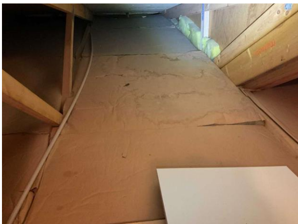
Bild 3: Utvändigt, Vind, Pappen på isoleringen visa äldre fuktspår