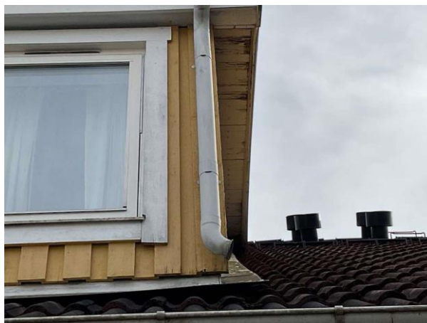
Bild 4: Utvändigt, Yttertak, Taket är besiktat i anslutning till taksäkerhet Takfotsprånget på kupan har rötskadad underlagstak