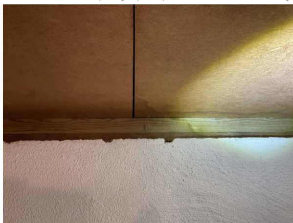
Bild 6: Invändigt, Källarplan, Tryckimpregnerat virke noteras i grunden (kan avge en kemisk lukt i en fuktig instängd miljö) Mindre rosor fläckar noteras på bjälklaget se riskanalys