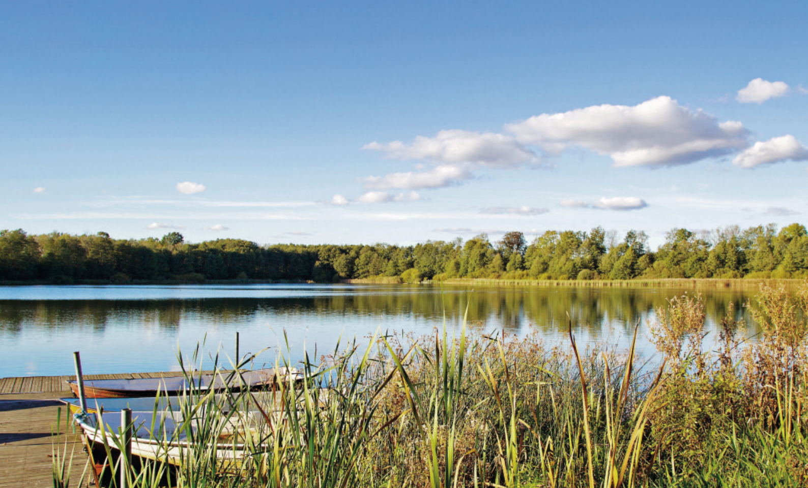
OVAN. FRÅN SJÖBO ÄR DET INTE LÅNGT TILL VACKRA SÖVDESJÖN.. NEDAN. VANDRINGSLEDER FINNS DET GOTT OM OCH DESSA BJUDER PÅ HÄRLIG NATUR OCH FANTASTISKA VYER.