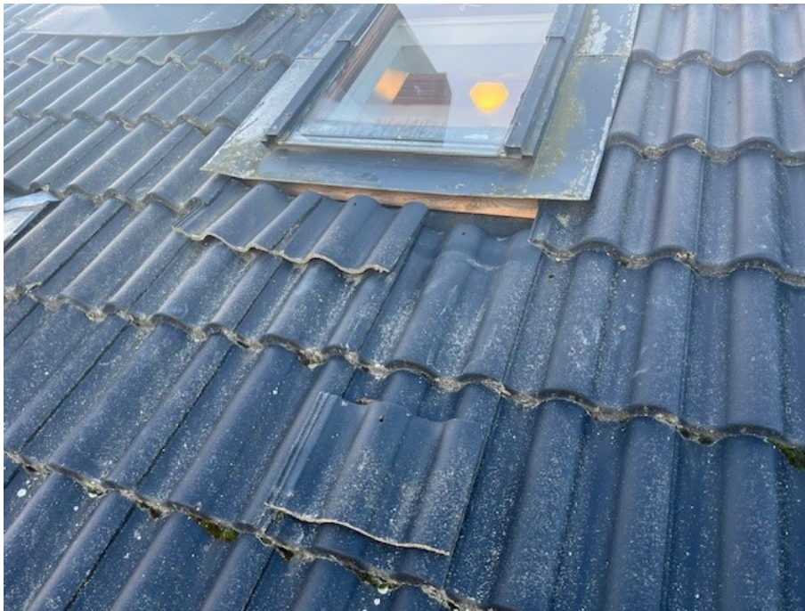
Takpannor som glidit ur sitt rätta läge under takfönster, dessa justerades vid aktuell besiktning.