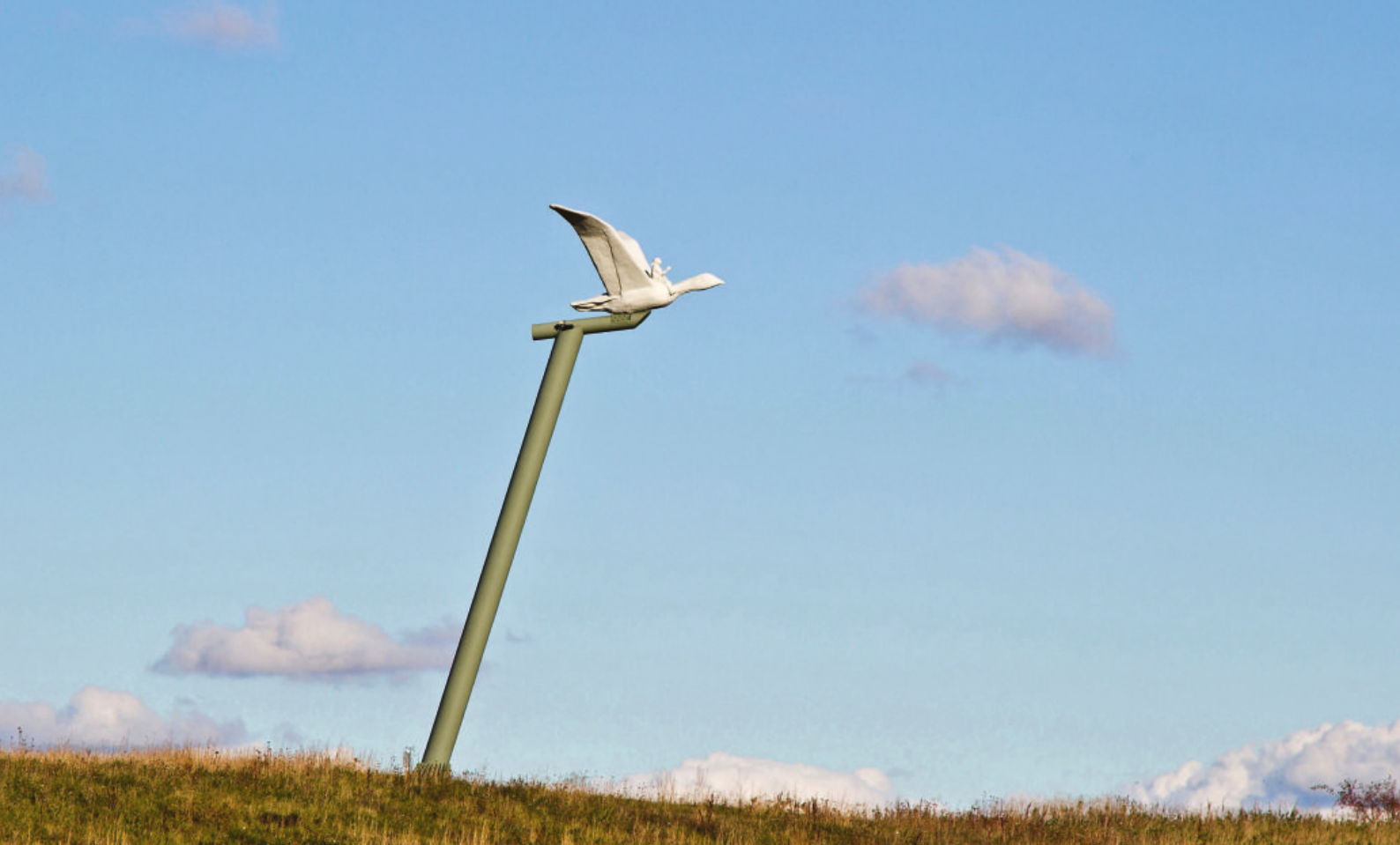
OVAN. STATYN AV NILS HOLGERSSON VÄLKOMNAR DIG IN TILL SKURUP FRÅN E65:AN. NEDAN. MYSIGA HAMNEN I ABBEKÅS.