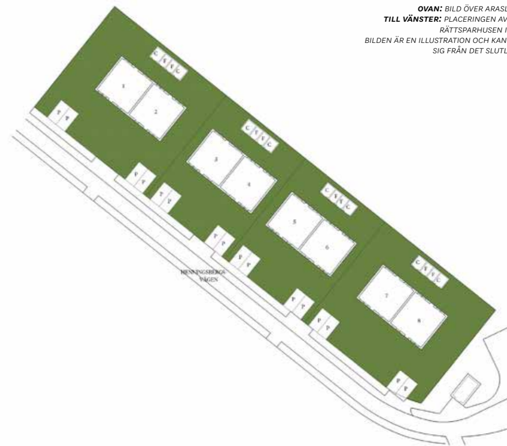
OVAN: BILD ÖVER ARASLÖV GOLF & RESORT. TILL VÄNSTER: PLACERINGEN AV DE ÅTTA BOSTADSRÄTTSPARHUSEN I BRF HEDVIGSPARK. BILDEN ÄR EN ILLUSTRATION OCH KAN KOMMA ATT SKILJASIG FRÅN DET SLUTLIGA UPPFÖRANDET.