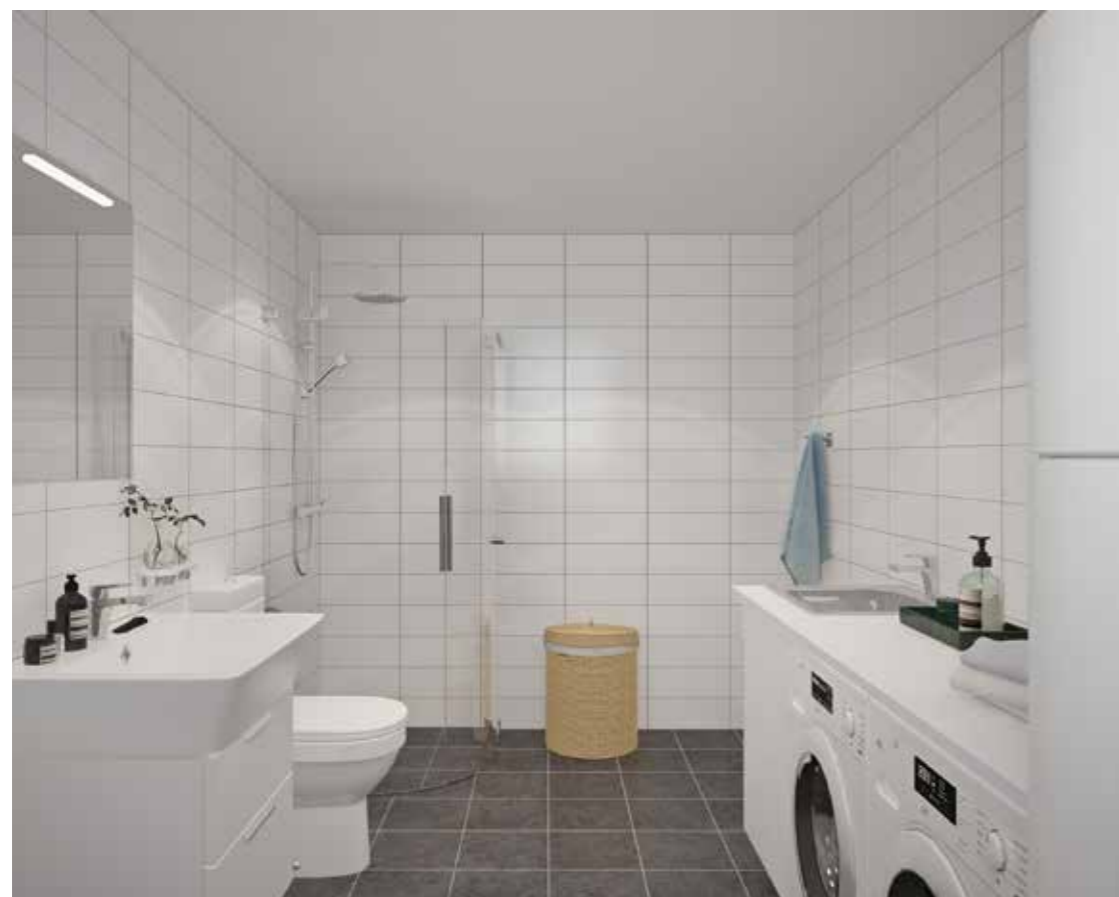
OVAN: VÄLPLANERAT SOVRUM MED SKJUTDÖRRS- GARDEROB. TILL VÄNSTER: WC/DUSCH/ TVÄTT ÄR I PRAKTISKT OCH STILRENT UTFÖRANDE.