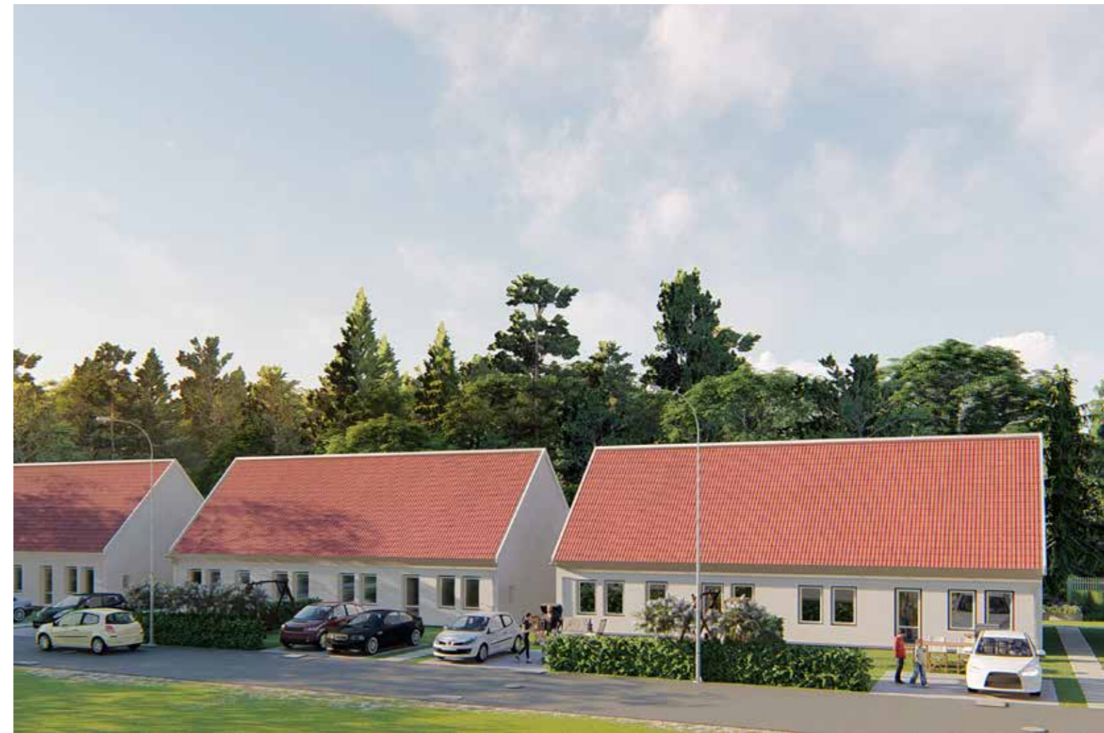
OVAN. UTVÄNDIGT ÄR FASADEN I VITMÅLAD PUTS OCH TAKBEKLÄDNADEN UTGÖRS AV RÖDA BETONGPANNOR. TILL HÖGER. PLACERINGEN AV DE ÅTTA BOSTADSRÄTTSPARHUSEN I BRF HEDVIGSPARK.

Husen är strategiskt placerade och utgör en harmonisk liten gata i ett hemtrevligt bostadsområde.