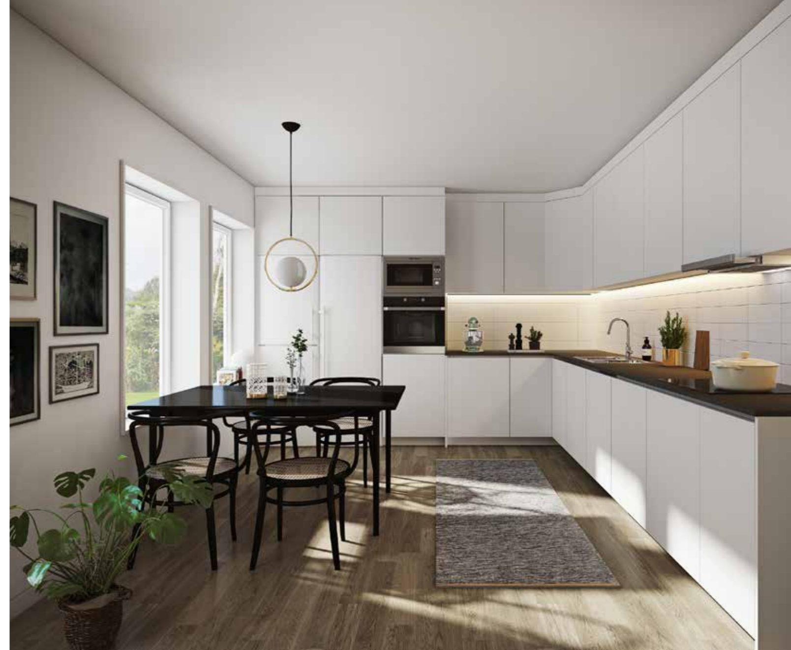
OVAN OCH TILL HÖGER: KÖK, MATPLATS OCH VARDAGSRUM LIGGER I EN ÖPPEN PLANLÖSNING OCH UTGÖR OPTIMALT VÄLPLANERADE SÄLLSKAPSYTOR.