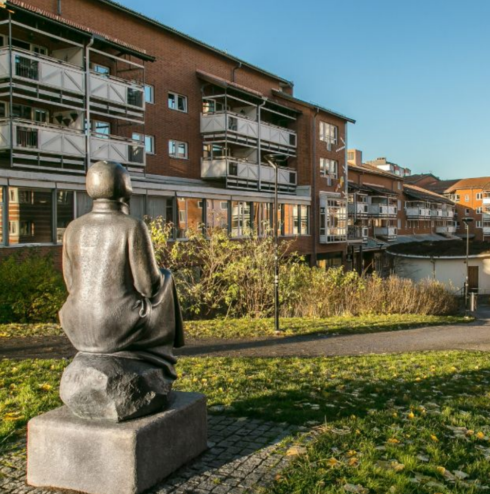
HUDDINGE ÄR FÖR DIG SOM SÖKER NÄRHET TILL BADKLIPPOR, STRÖVOMRÅDEN OCH SPORTAKTIVITETER MEN SAMTIDIGT DIREKT NÄRHET TILL STORSTADSPULSEN I CENTRALA STOCKHOLM.