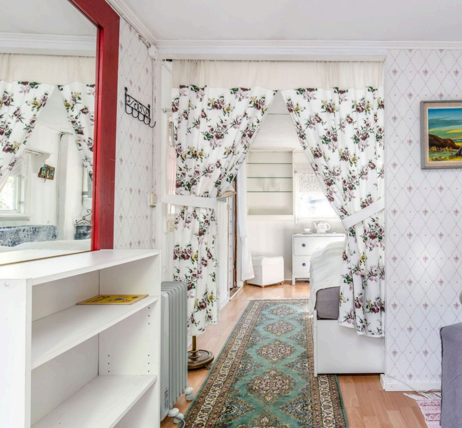
GÄSTHUS DENNA MYSIGA LILA STUGA RYMMER NÄSTAN TVÅ RUM, MYSIGT OCH EXTREMT OMBONAT MED EN EGEN UTEPLATS. TOA FINNS I HUSET.