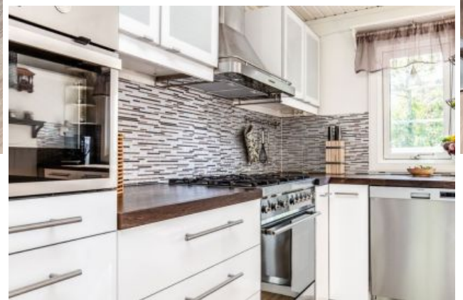
— Kök & sovrum/matrum. —