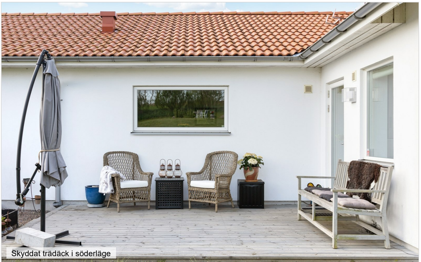
Skyddat trädäck i söderläge