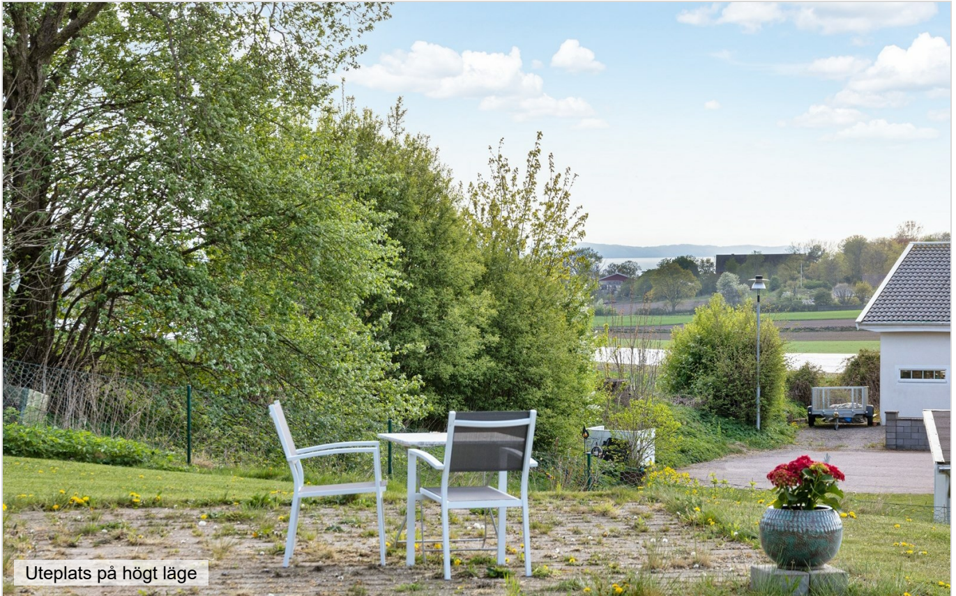
Uteplats på högt läge