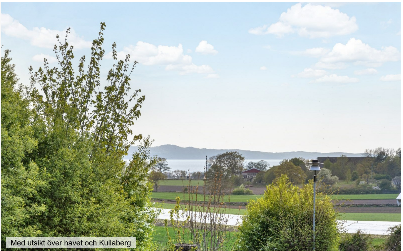
Med utsikt över havet och Kullaberg