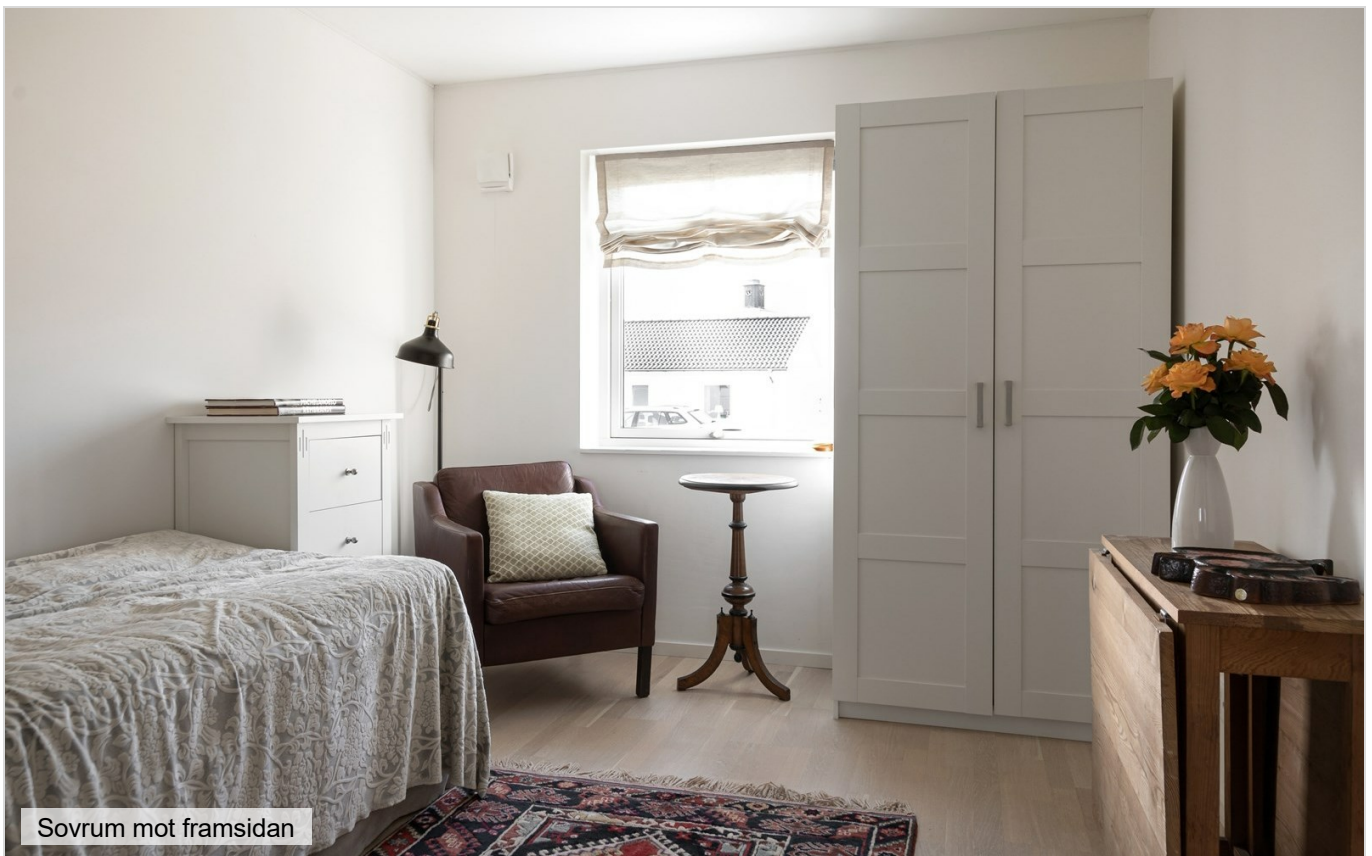
Sovrum mot framsidan