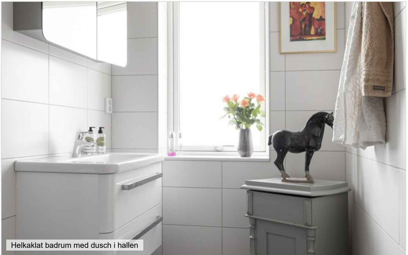
Helkaklat badrum med dusch i hallen