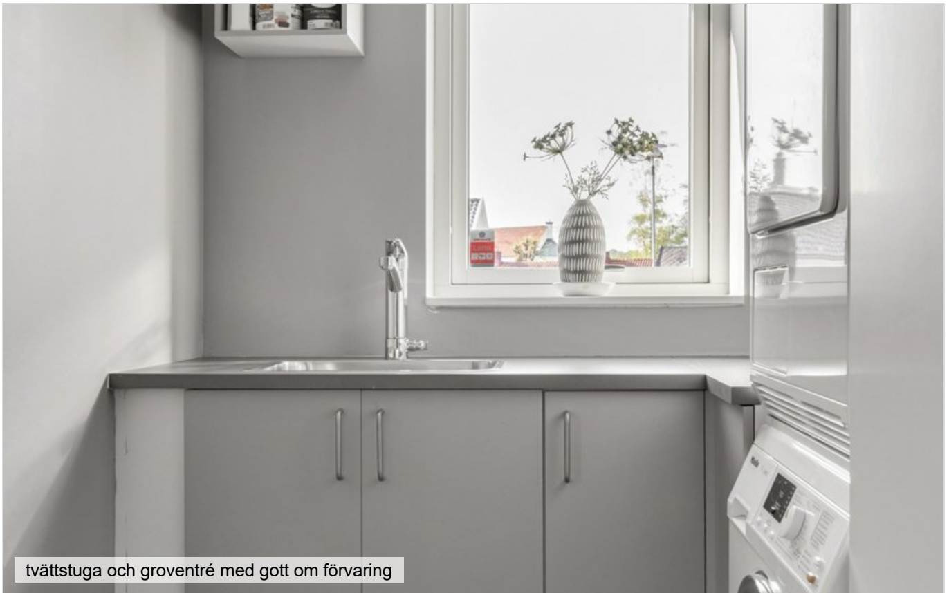
tvättstuga och groventré med gott om förvaring