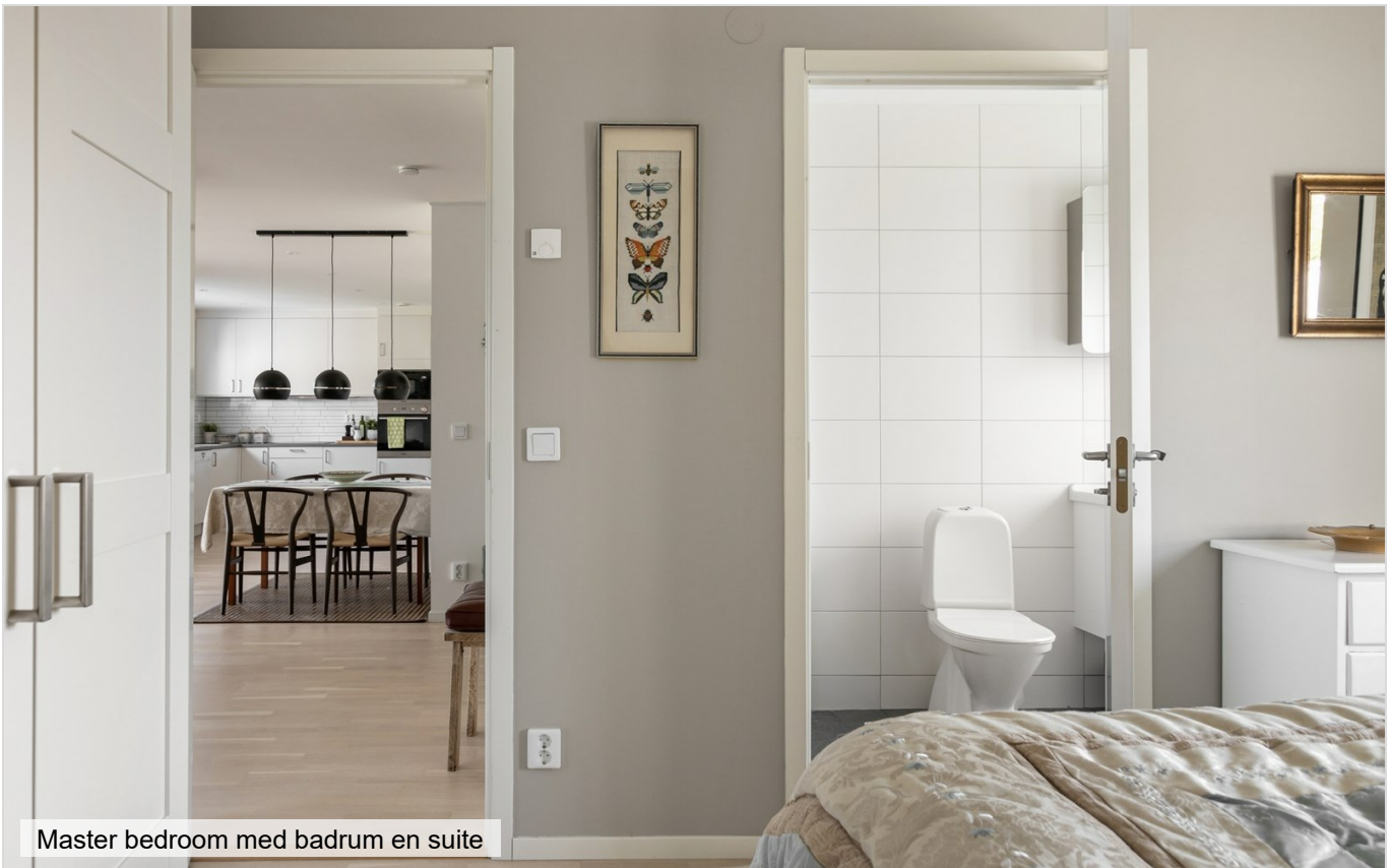
Master bedroom med badrum en suite