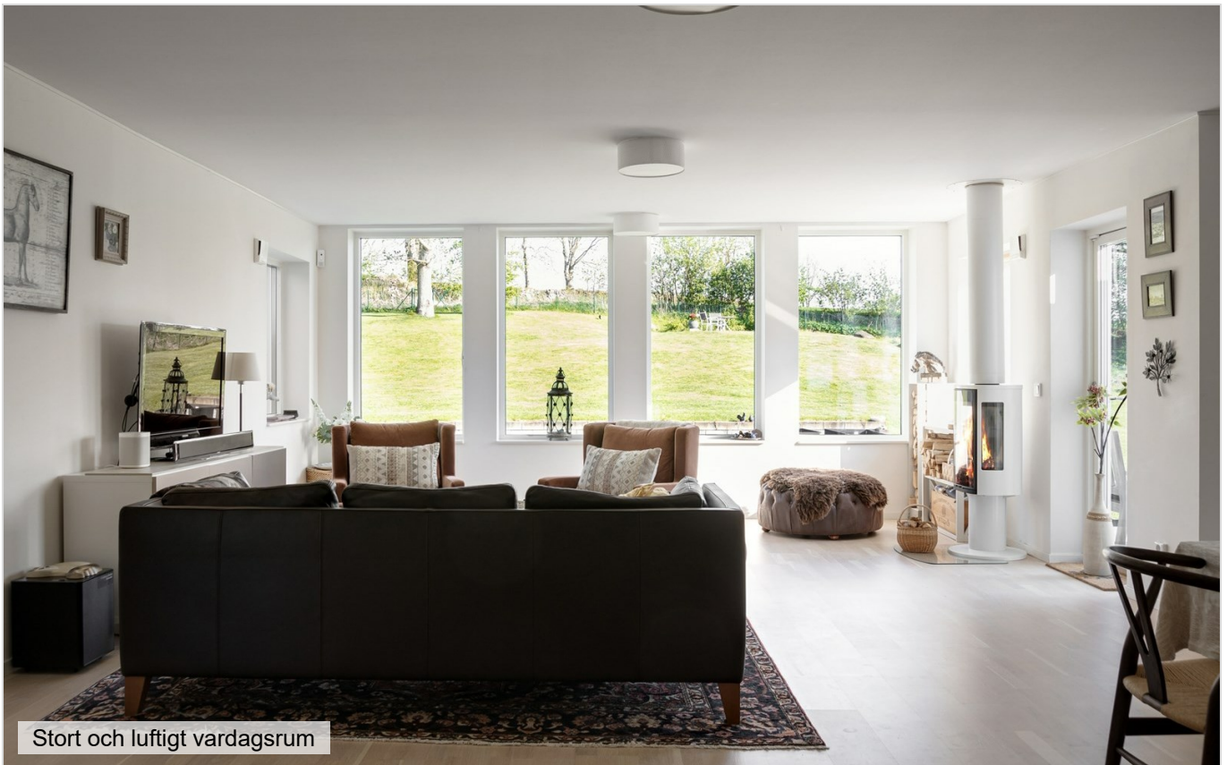
Stort och luftigt vardagsrum