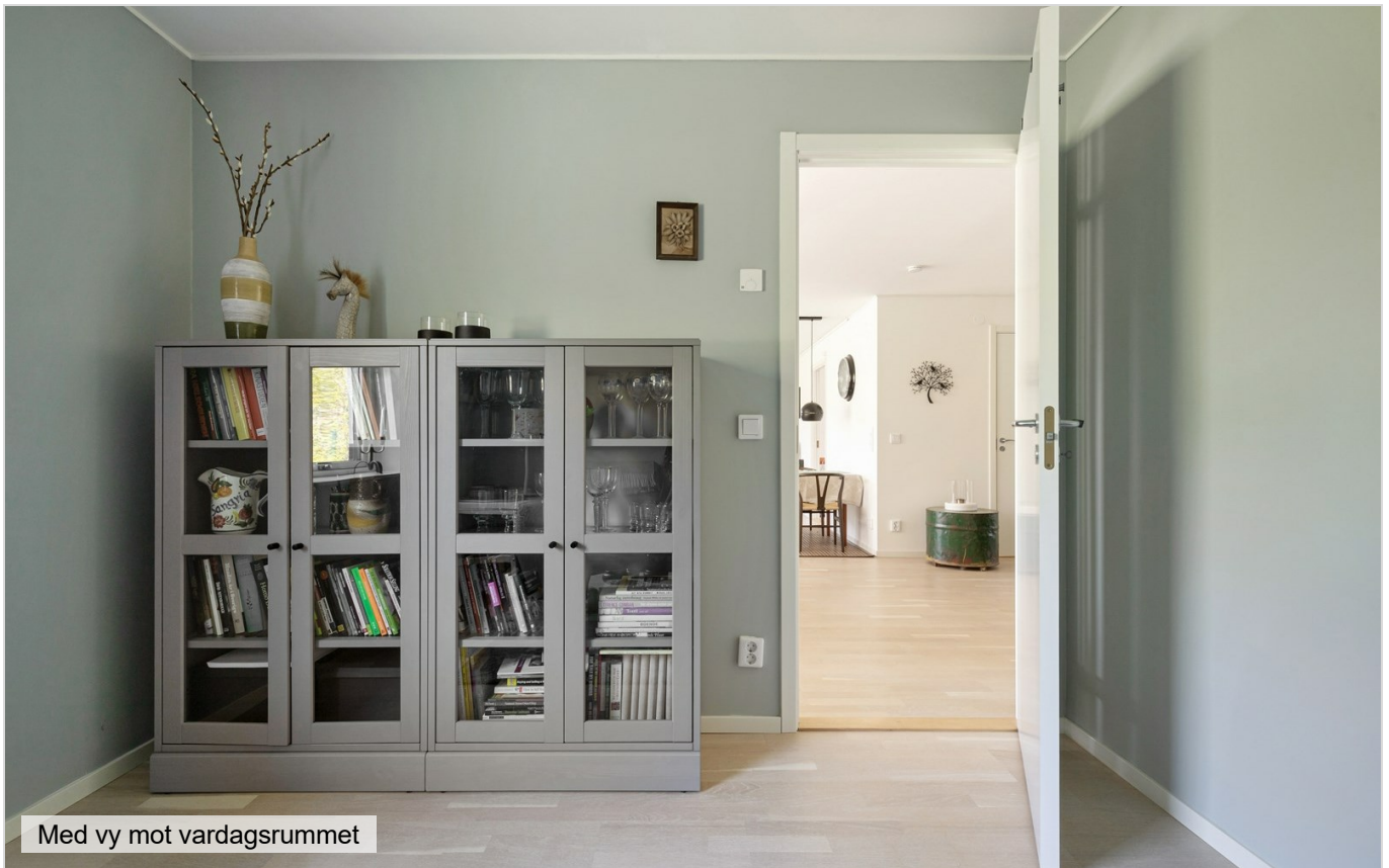
Med vy mot vardagsrummet