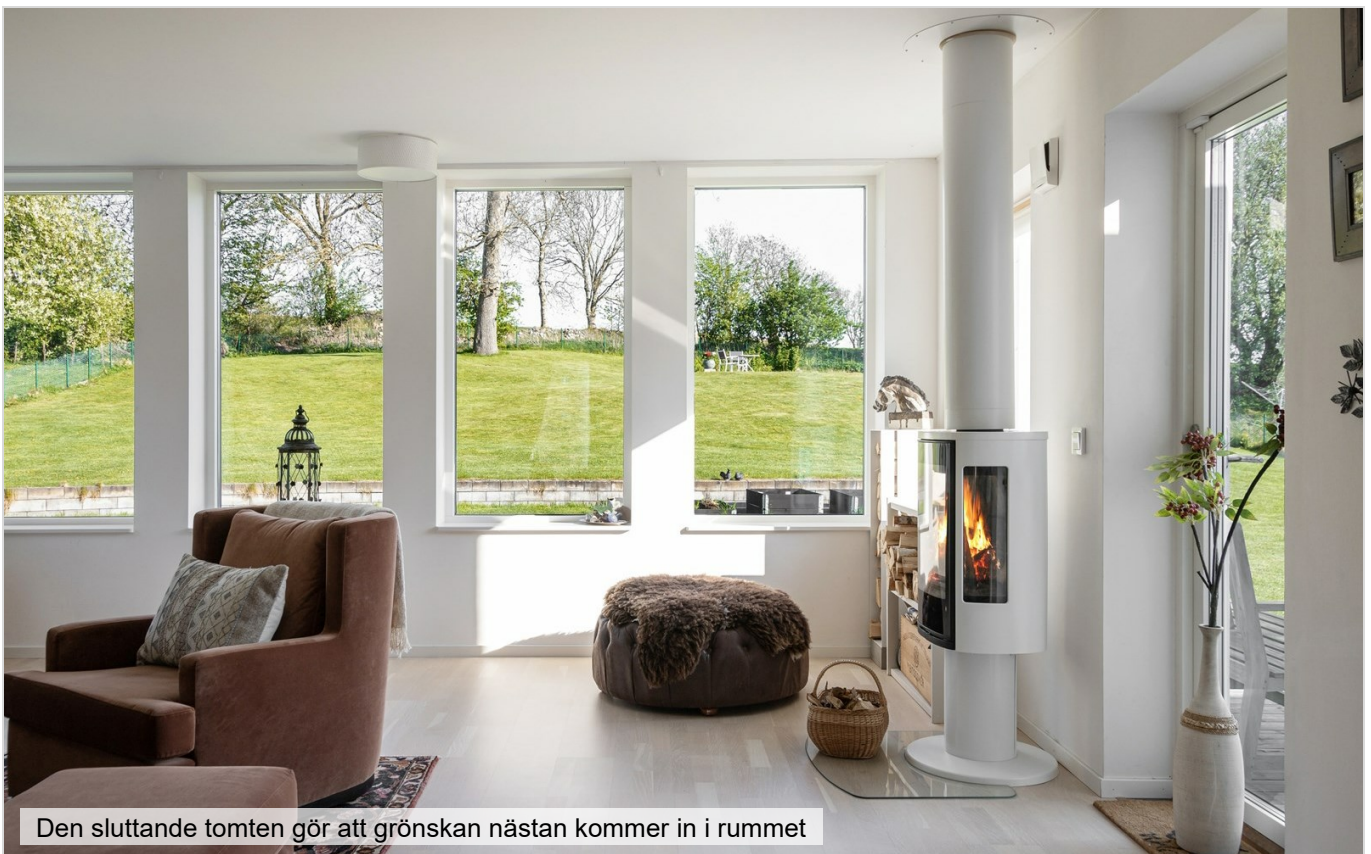
Den sluttande tomten gör att grönskan nästan kommer in i rummet