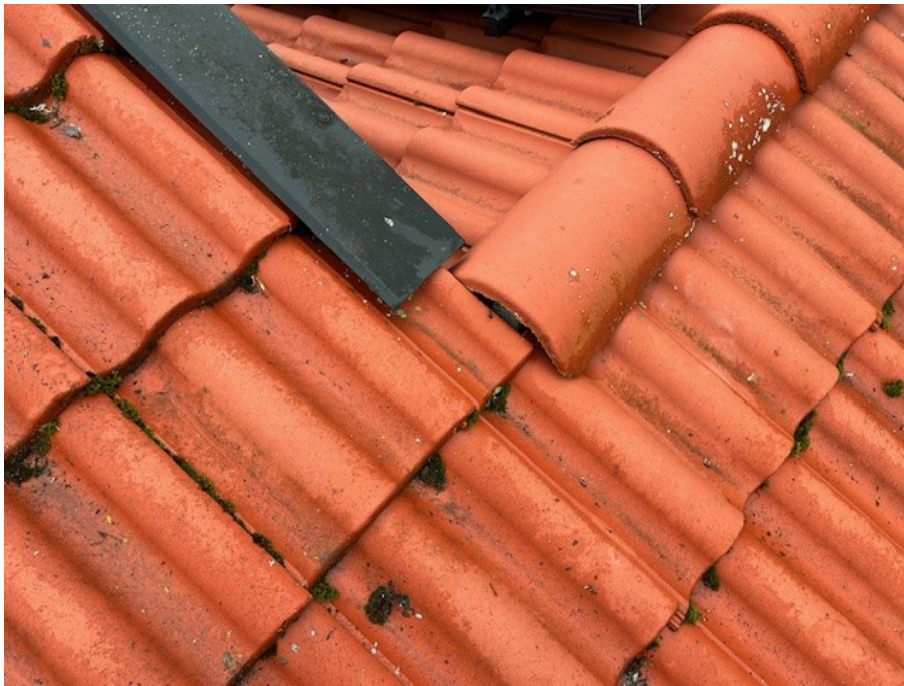
Mindre otäthet vid nockpanna mellan huskroppar över sovrum/TV-rum.