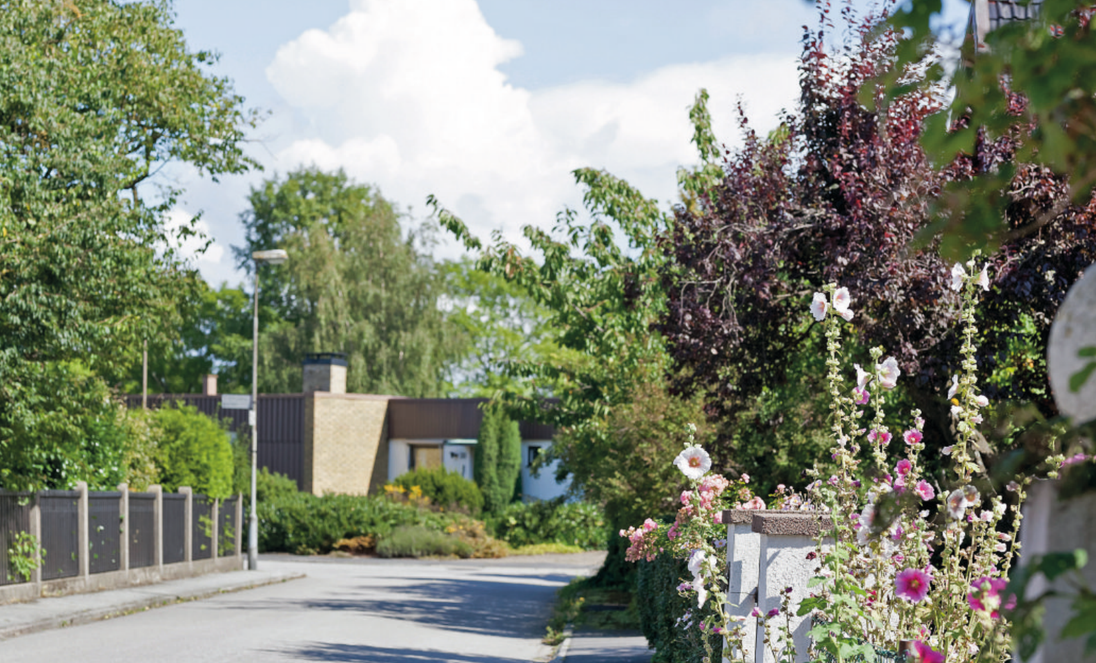
OVAN. GULLVIK BJUDER PÅ MYSIGA VILLAGATOR. NEDAN. HÄR HAR SÅKLART KUNGEN EN EGEN FOTBOLLSPLAN.