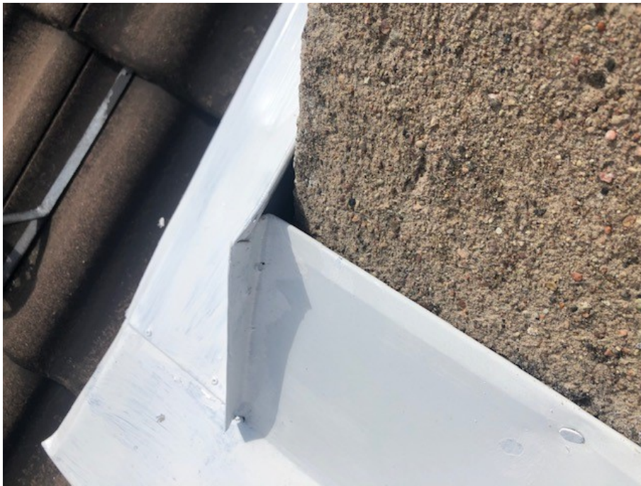
Plåtinklädnad kring skorstenen tätar bristfälligt mot skorstenen.