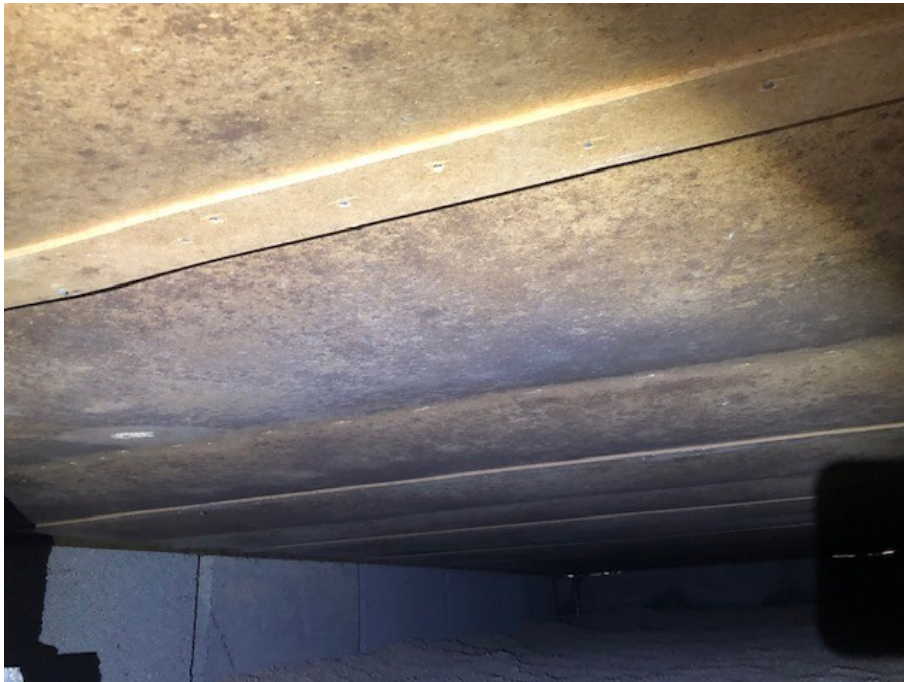
Mikrobiell påväxt på bjälklagets undersida (krypgrunden).