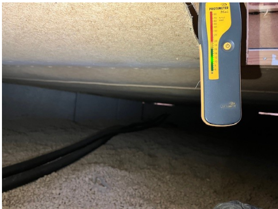
Fuktmätning i krypgrunden.

Fuktkvoten uppmättes vid aktuell besiktning till 11-12 % i bjälklagets undersida, kritiskt värde för mikrobiell växt (mögél/bakterier) är cirka 17 %.