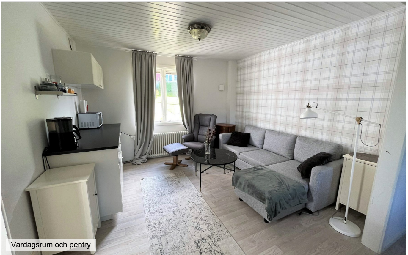
Vardagsrum och pentry