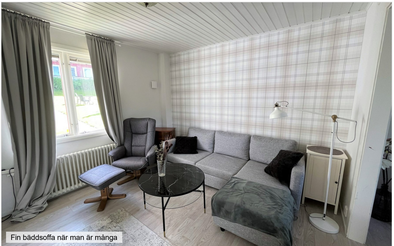
Fin bäddsoffa när man är många