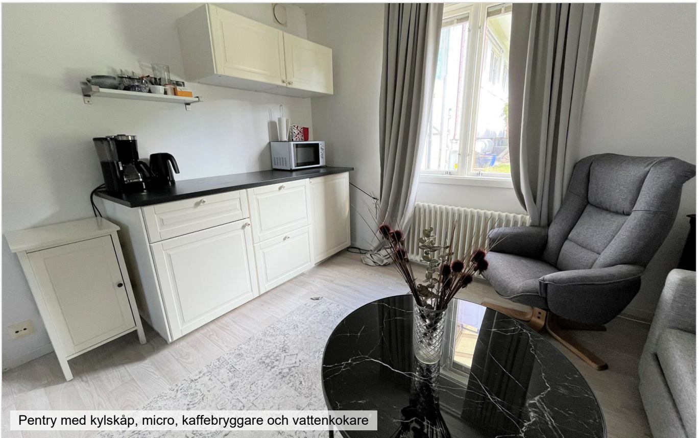
Pentry med kylskåp, micro, kaffebryggare och vattenkokare