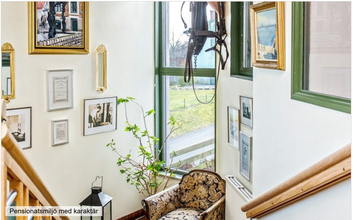
Pensionatsmiljö med karaktär