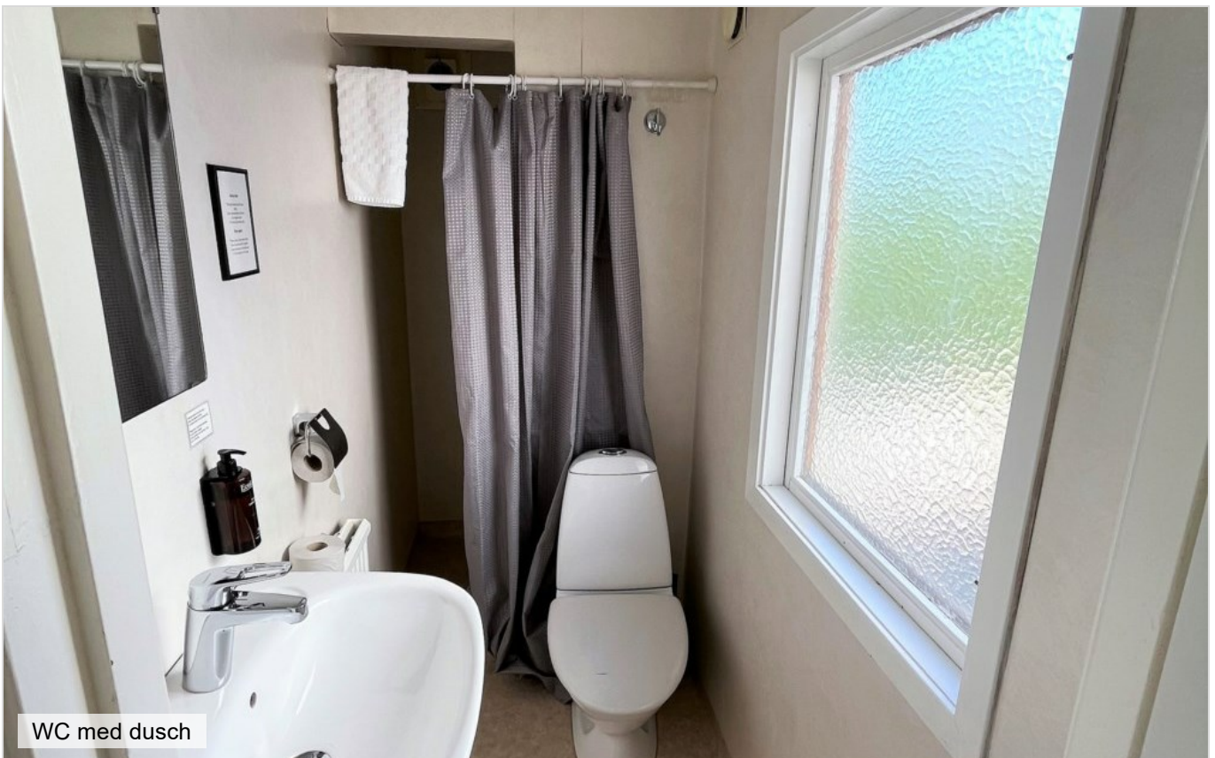
WC med dusch