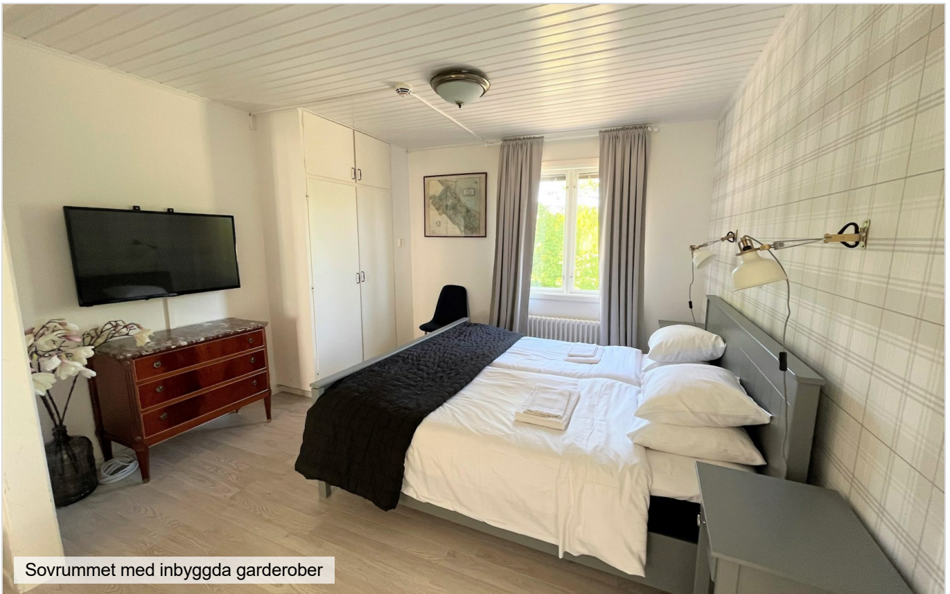
Sovrummet med inbyggda garderober