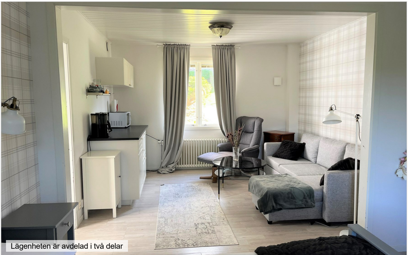
Lägenheten är avdelad i två delar