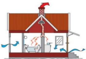
Frisk luft är bra för hus och kropp

Frisk luft, en ren hälsofråga. Eftersom vi vistas inomhus mer än 70 % av vår tid så är det av högsta vikt att vi skall ha en väl fungerande ventilation i våra hus.