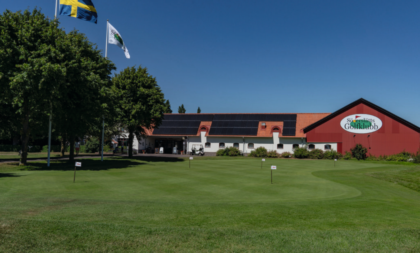
OVAN. SPELA GOLF UTANFÖR VELLINGE I SKÅNSK LANTMILJÖ PÅ SÖDERSLÄTTS GOLFKLUBB NEDAN. PÅ BJÖRNSKONDITORI BJUDS DET PÅ KLASSISKT KONDITORIUTBUD MED EN MODERN KÄNSLA.