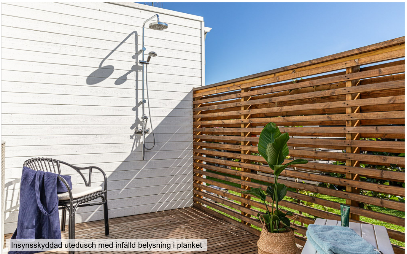
Insynsskyddad utedusch med infälld belysning i planket