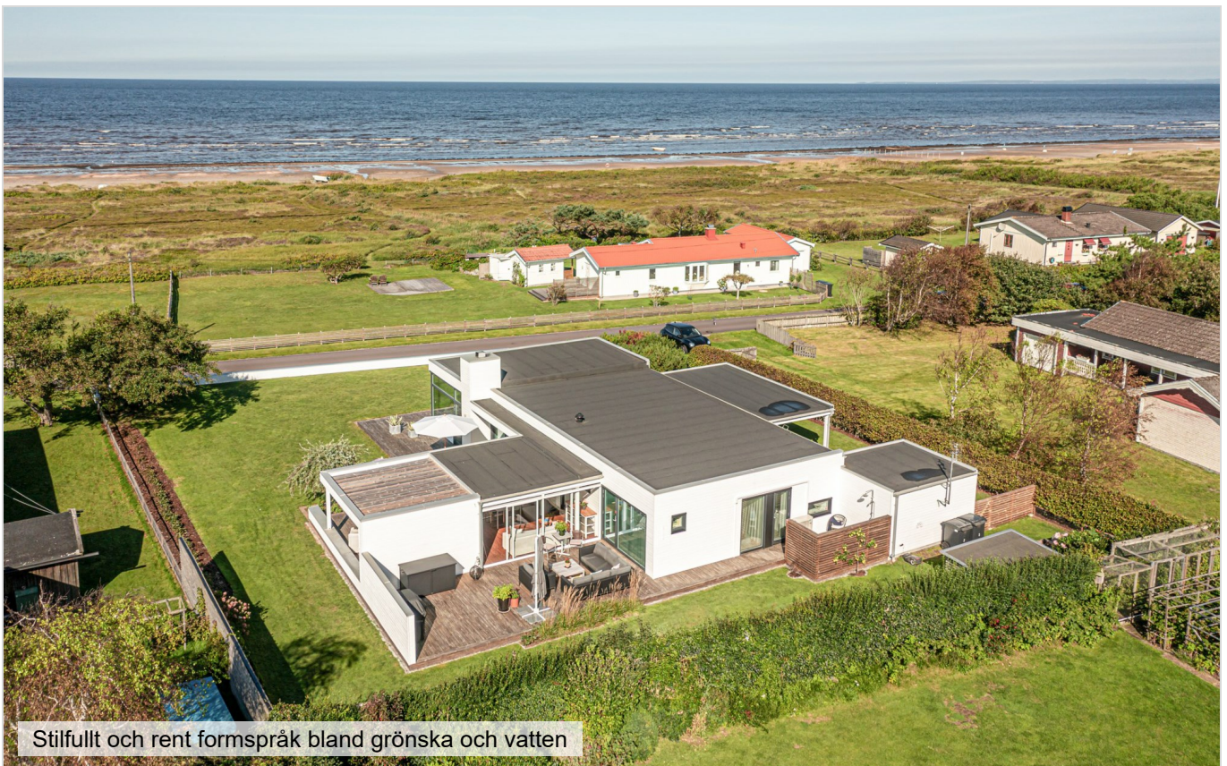
Stilfullt och rent formspråk bland grönska och vatten