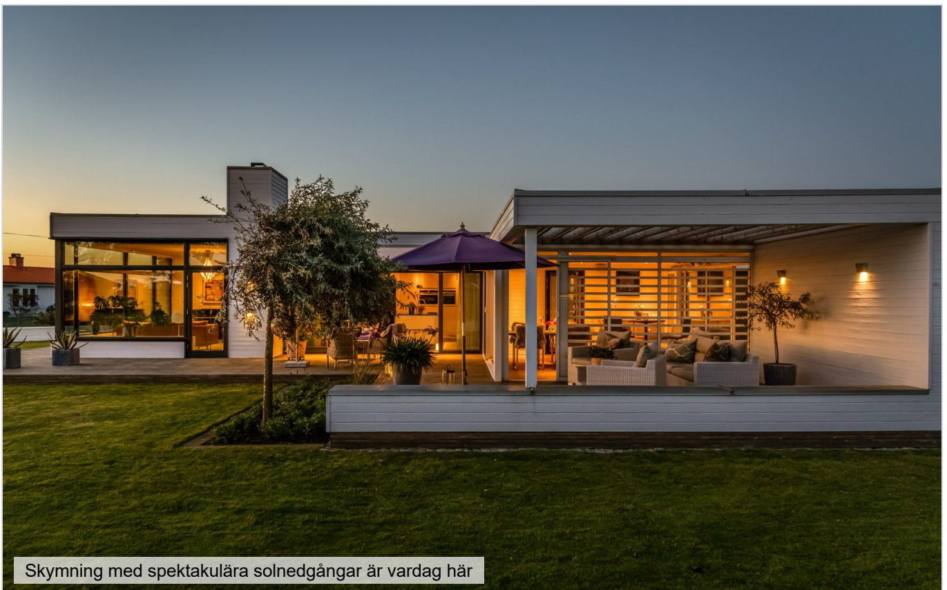
Skymning med spektakulära solnedgångar är vardag här