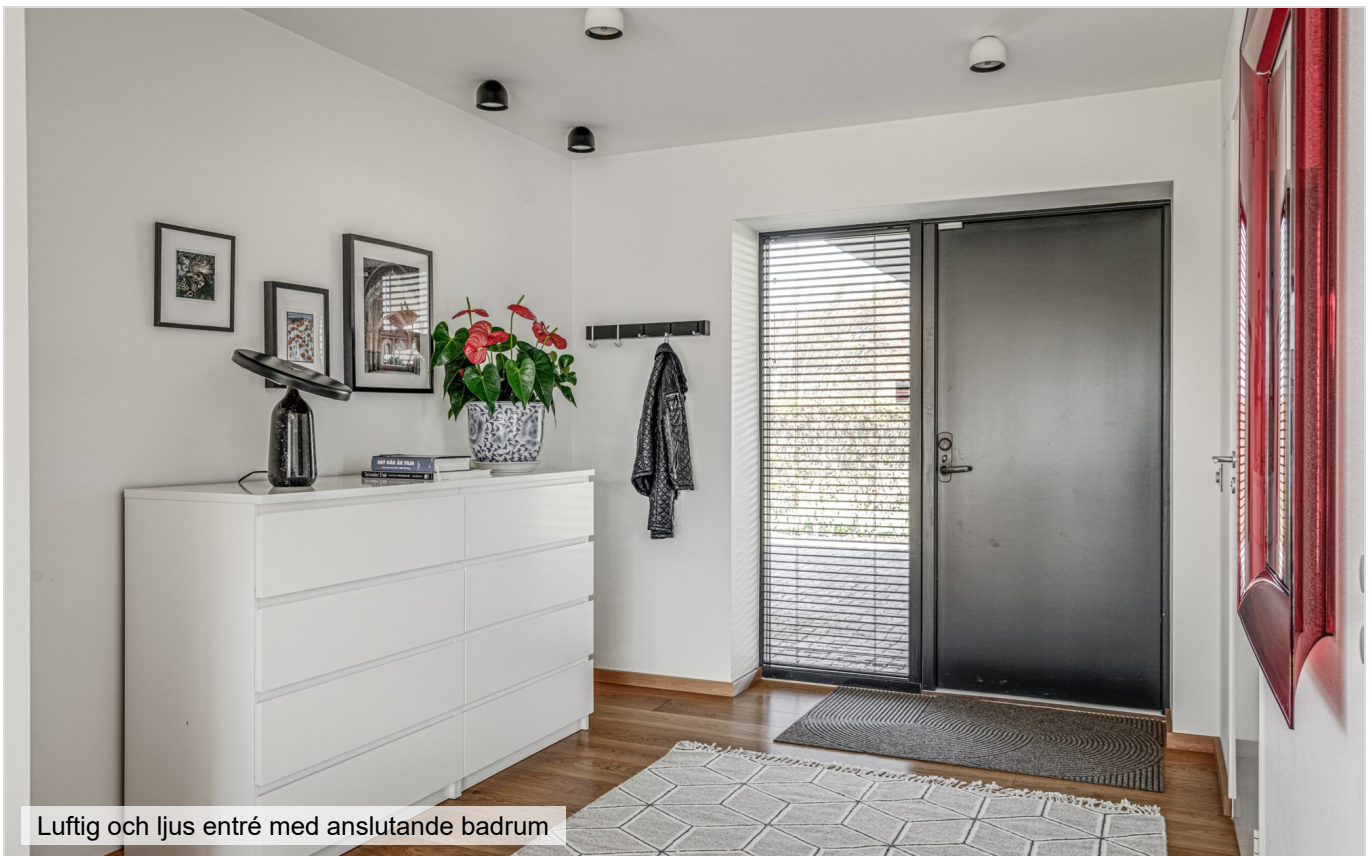
Luftig och ljus entré med anslutande badrum