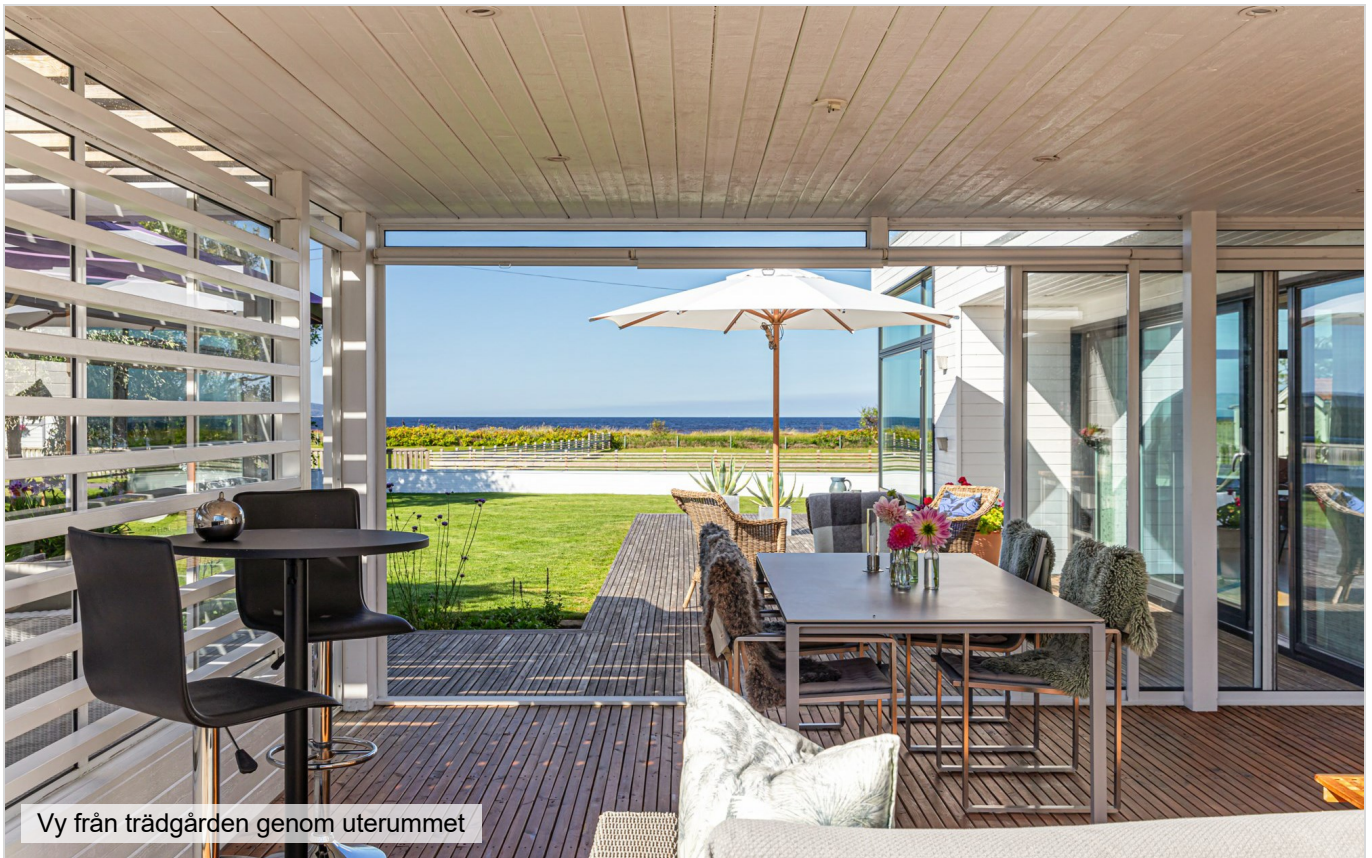
Vy från trädgården genom uterummet