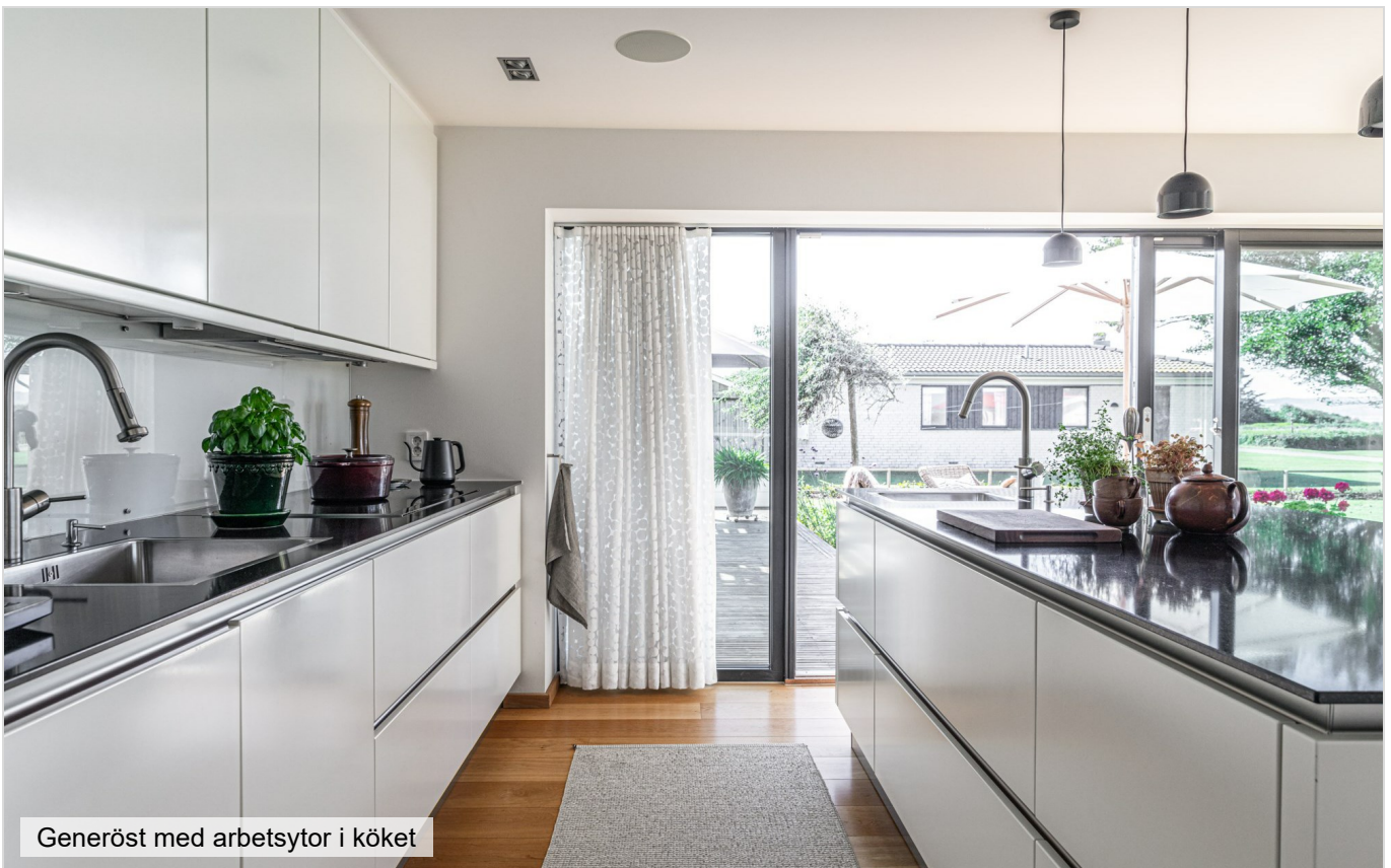
Generöst med arbetsytor i köket