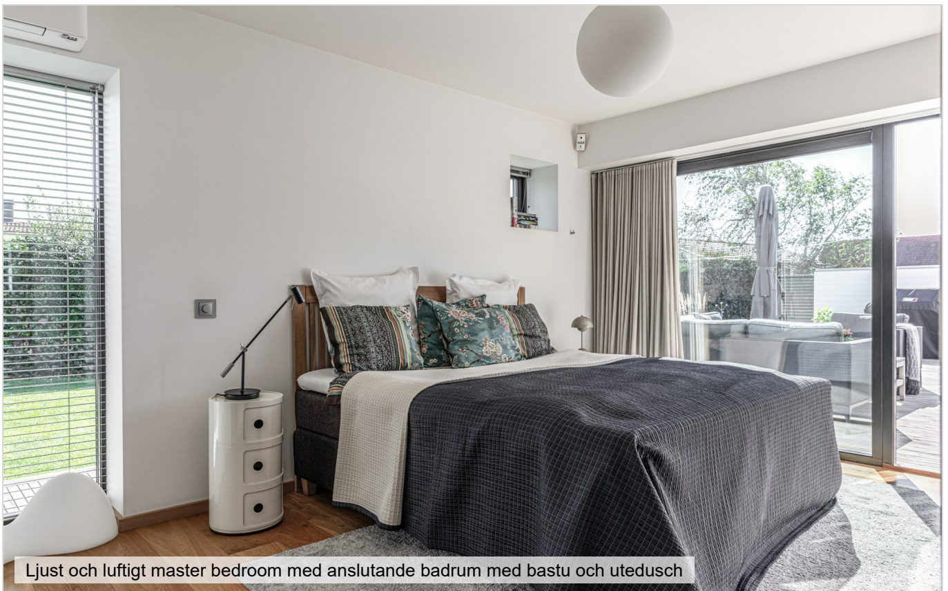
Ljust och luftigt master bedroom med anslutande badrum med bastu och utedusch