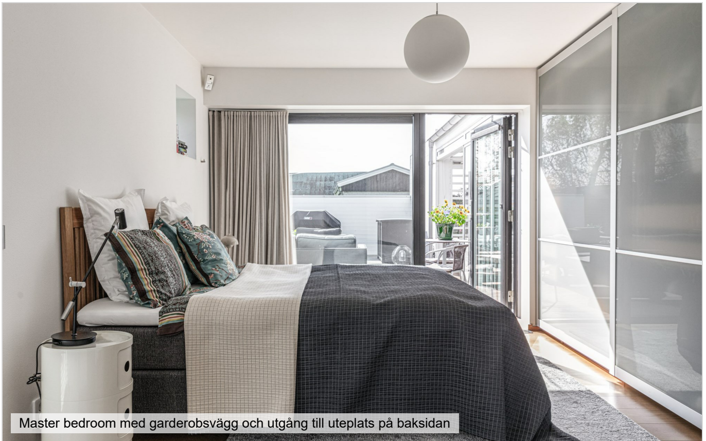
Master bedroom med garderobsvägg och utgång till uteplats på baksidan