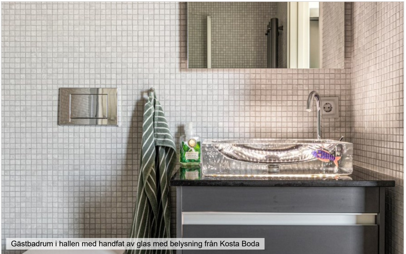
Gästbadrum i hallen med handfat av glas med belysning från Kosta Boda