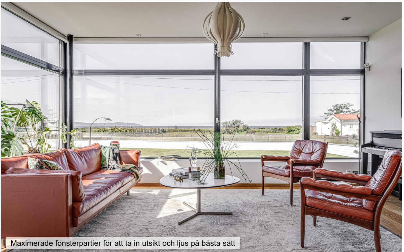
Maximerade fönsterpartier för att ta in utsikt och ljus på bästa sätt