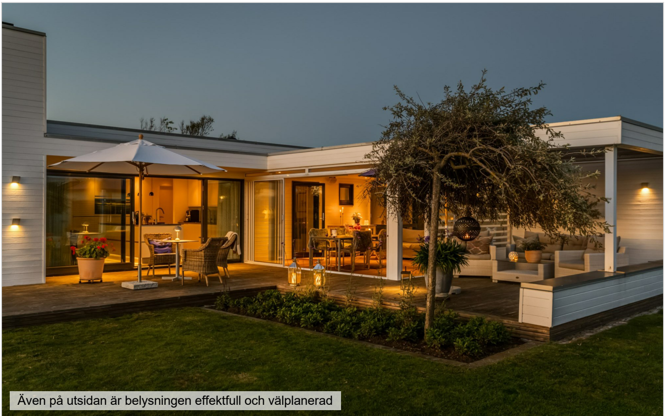
Även på utsidan är belysningen effektiv och välplanerad