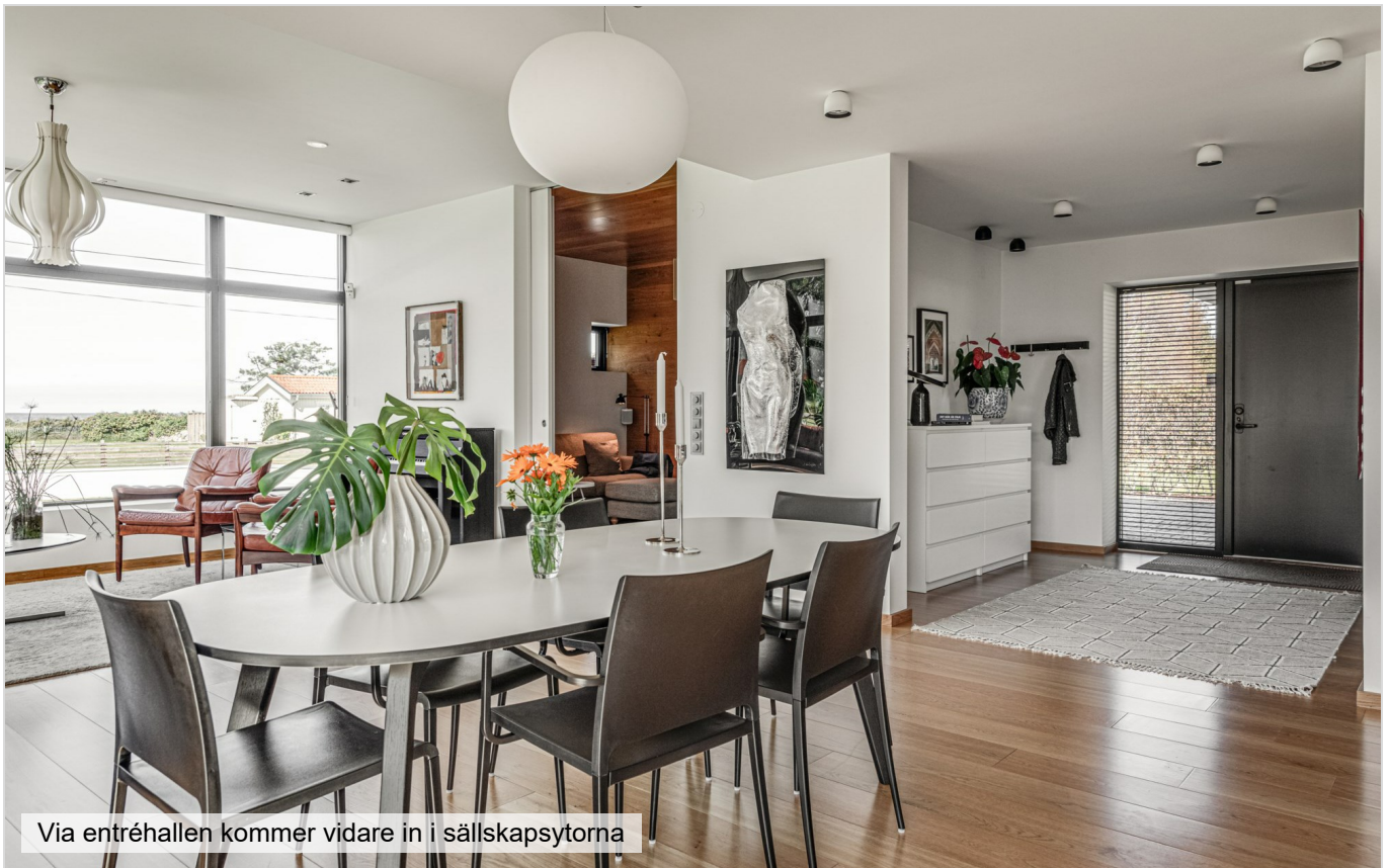
Via entréhallen kommer vidare in i sällskapsytorna