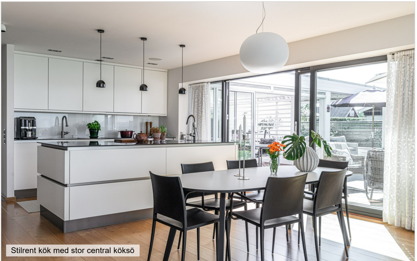
Stilrent kök med stor central köksö