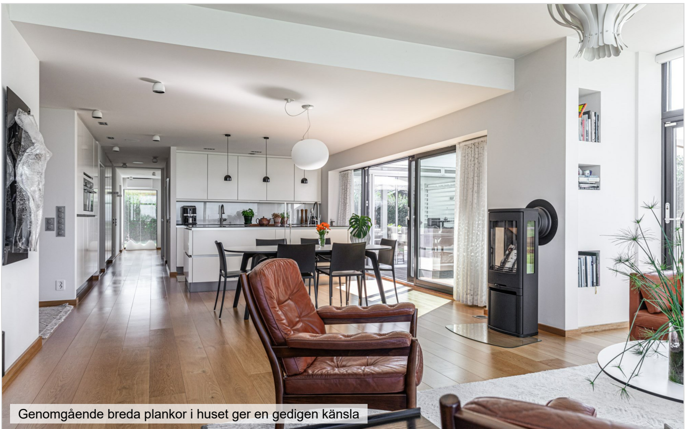
Genomgående breda plankor i huset ger en gedigen känsla