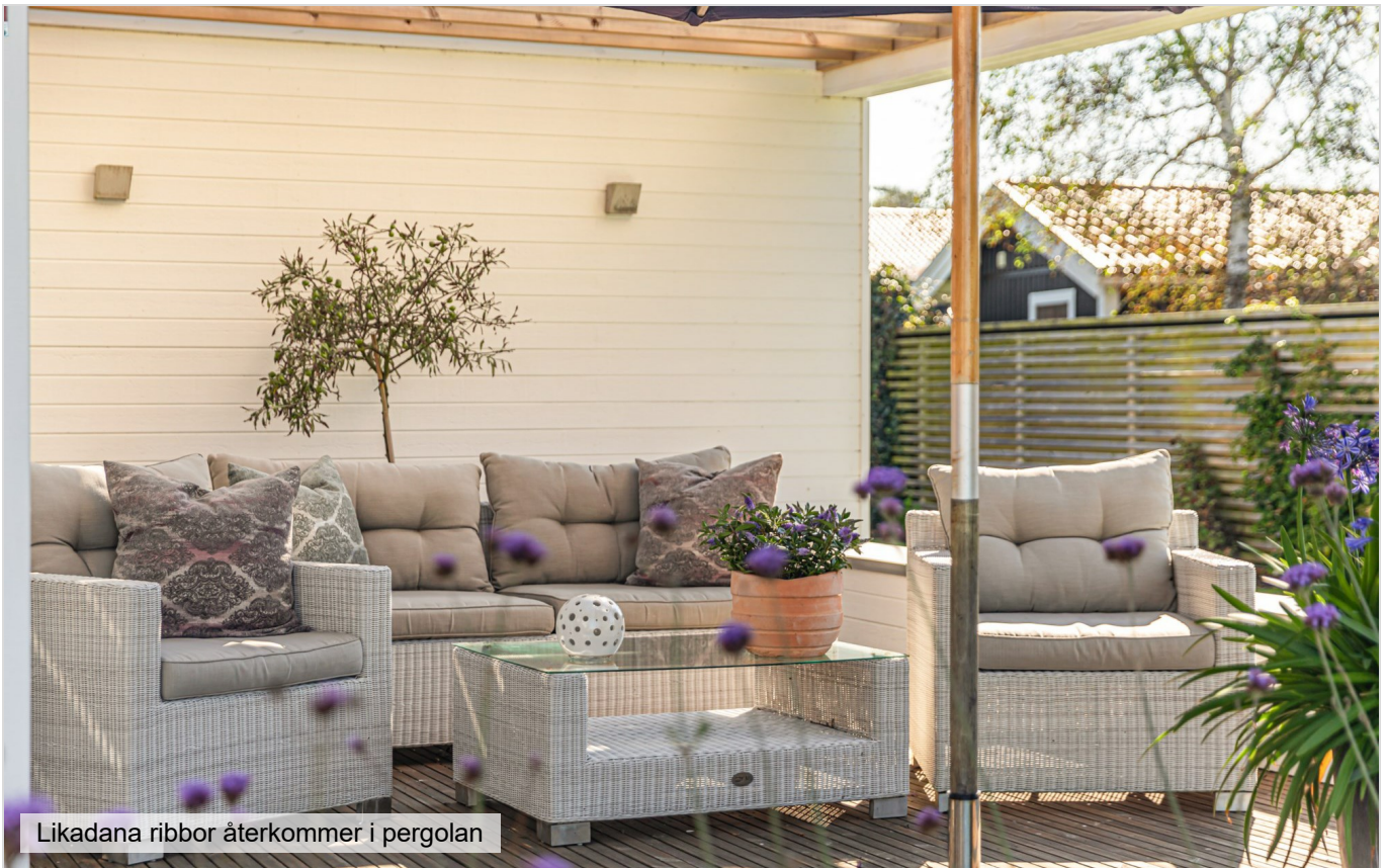
Likadana ribbor återkommer i pergolan