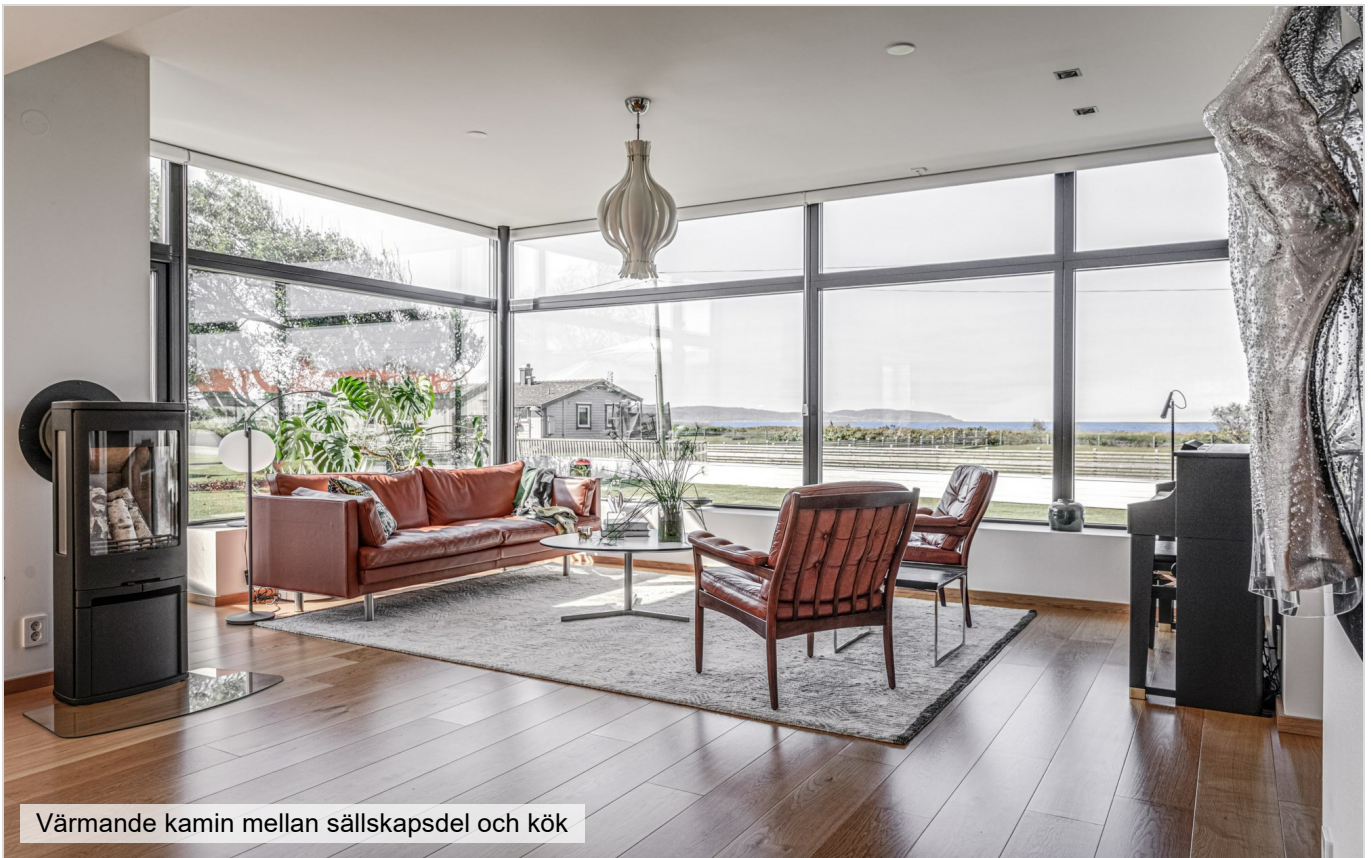
Värmande kamin mellan sällskapsdel och kök