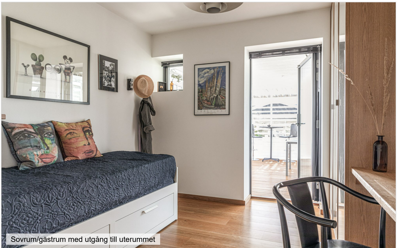
Sovrum/gästrum med utgång till uterummet