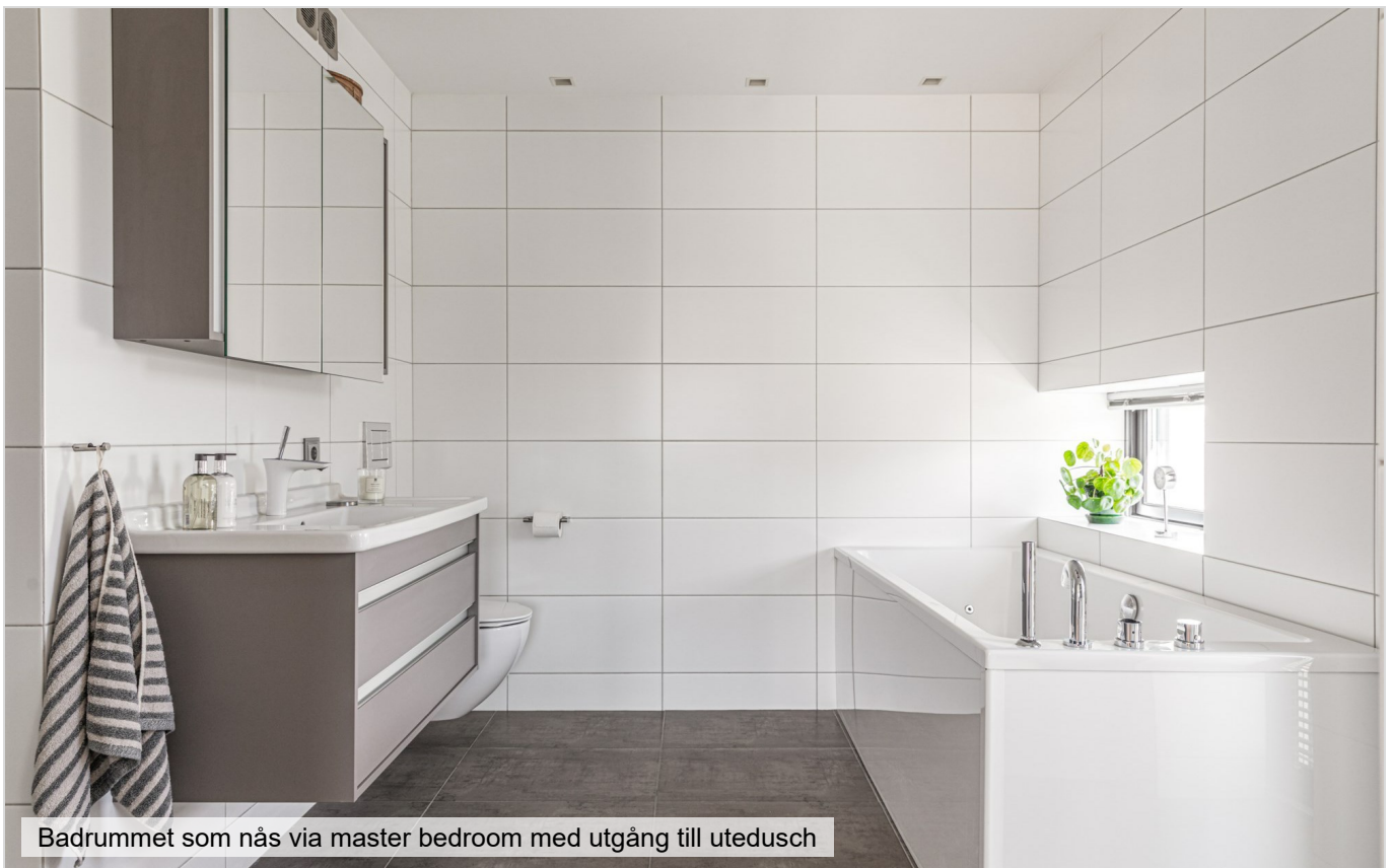
Badrummet som nås via master bedroom med utgång till utedusch