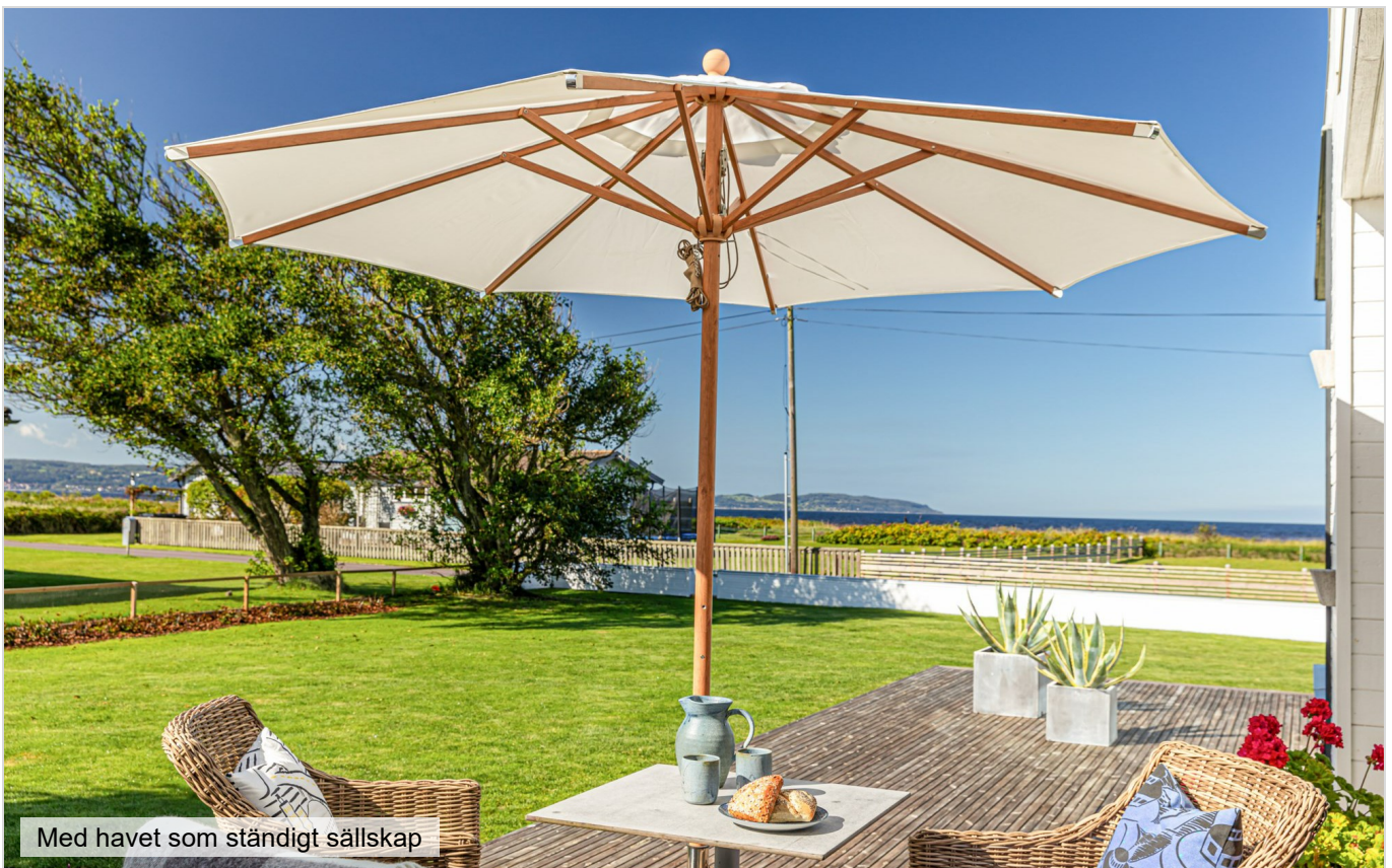
Med havet som ständigt sällskap