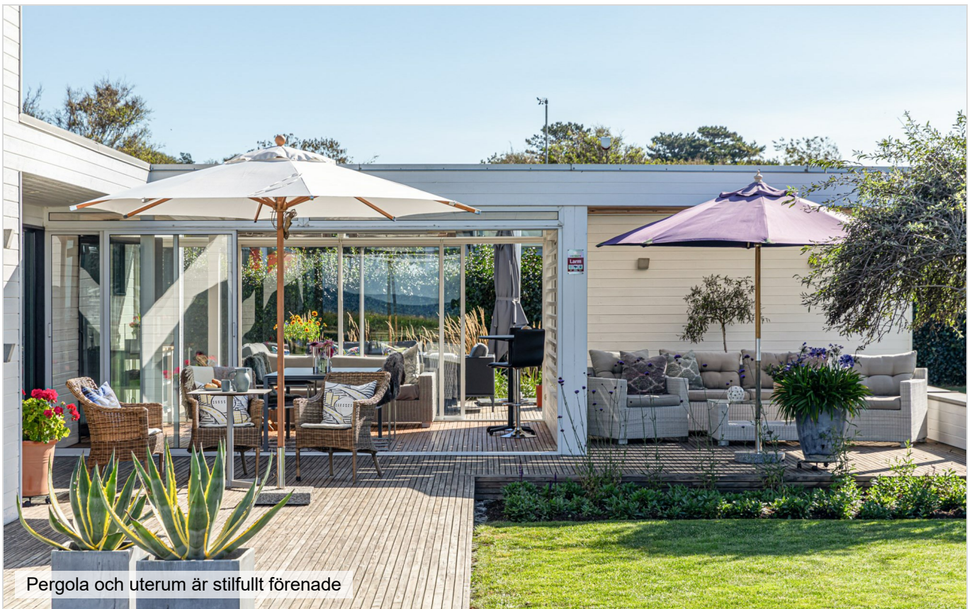
Pergola och uterum är stilfullt förenade