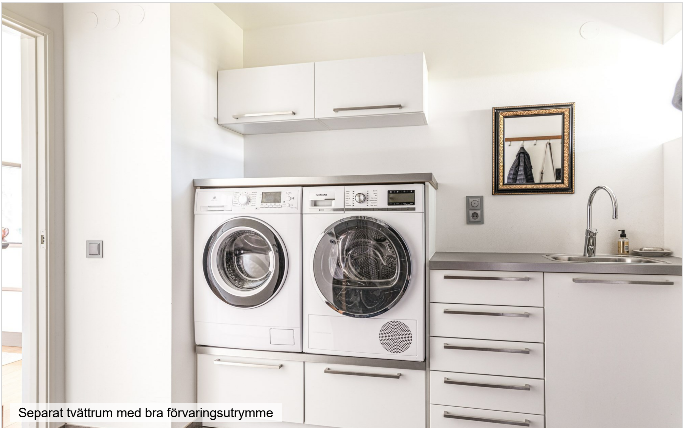
Separat tvättrum med bra förvaringsutrymme