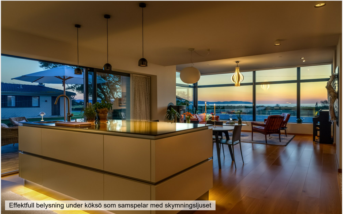
Effektfull belysning under köksö som samsplar med skymningsljuset