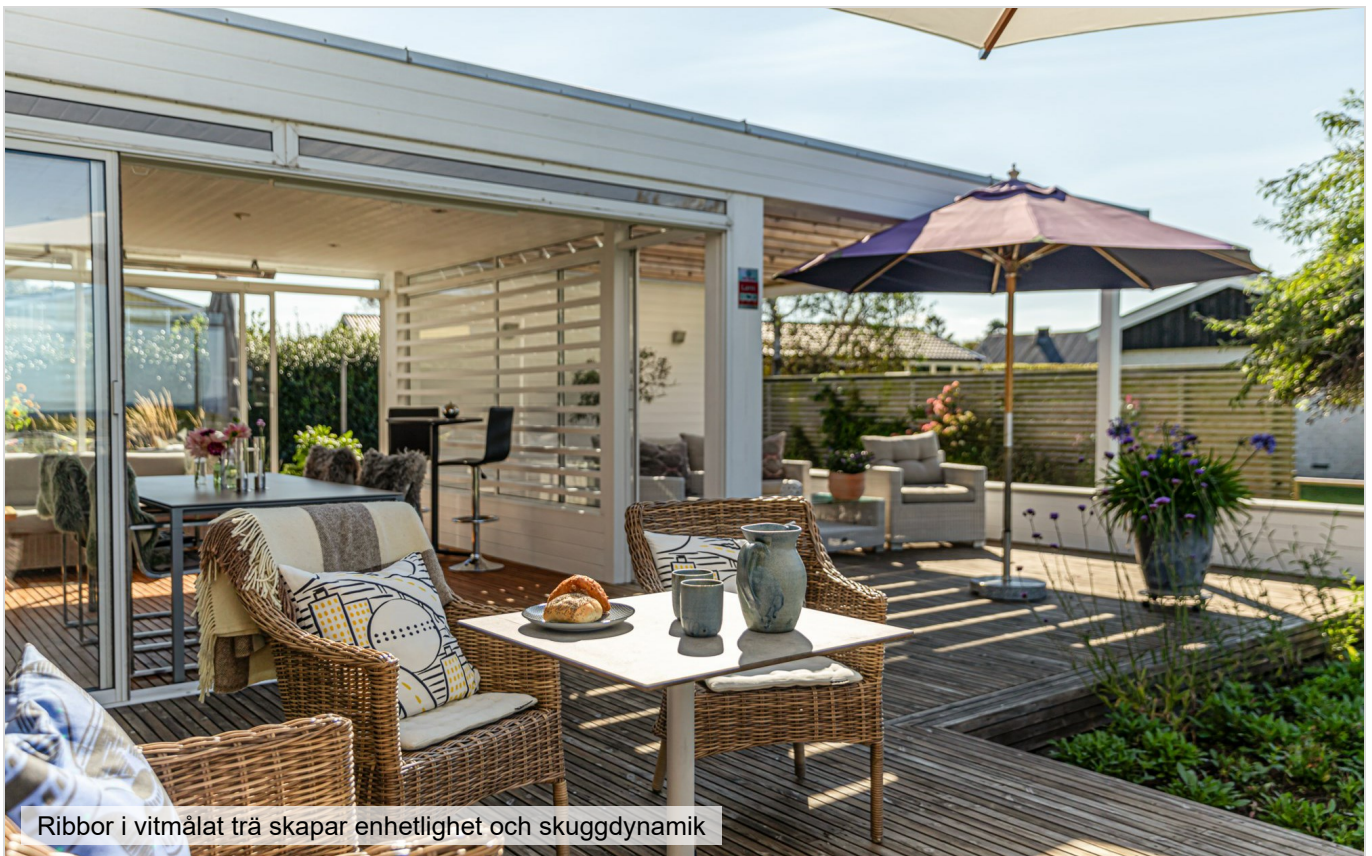
Ribbor i vitmålat trä skapar enhetlighet och skuggdynamik