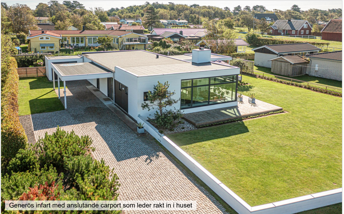
Generös infart med anslutande carport som leder rakt in i huset