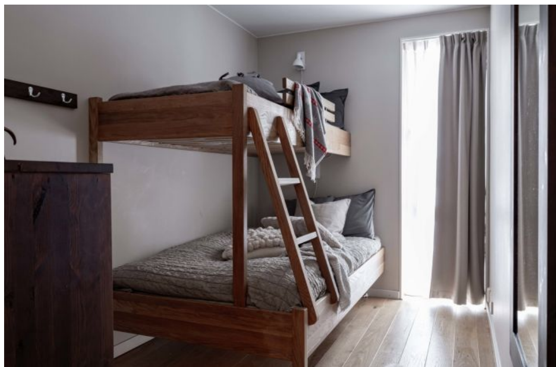
Rumsbeskrivning | TOTTVÄGEN 117A, FRESK A51