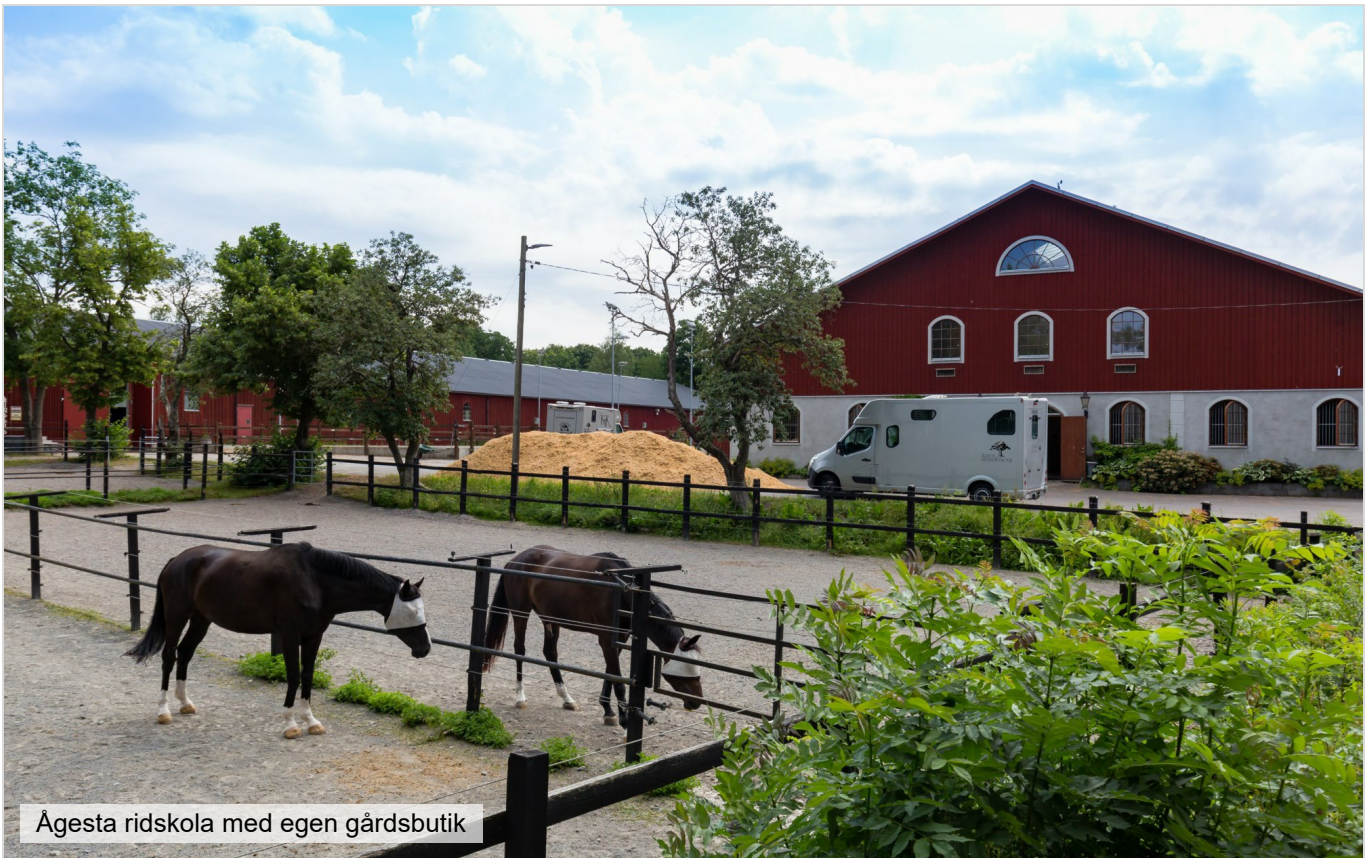
Ägesta ridskola med egen gårdsbutik