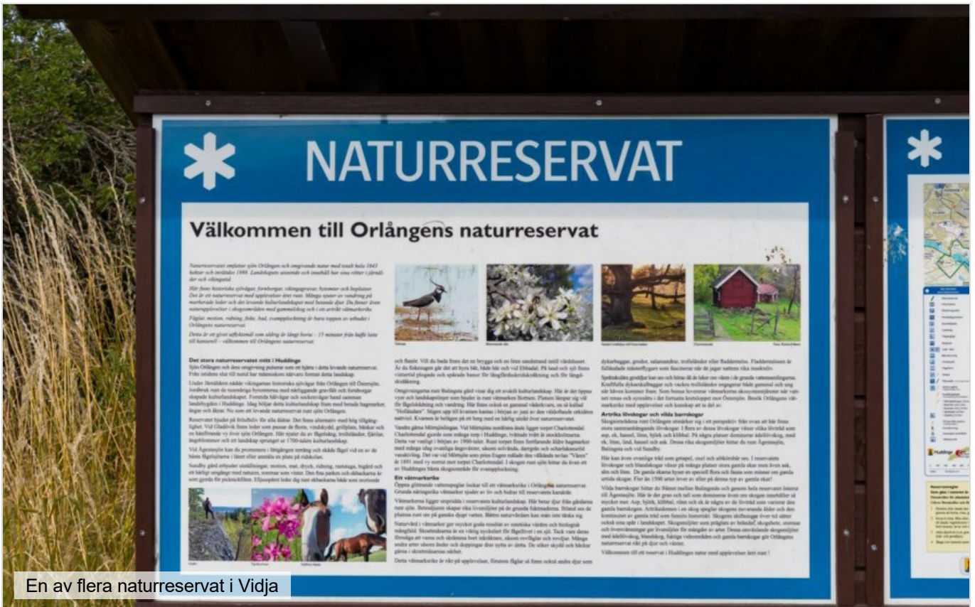
En av flera naturreservat i Vidja