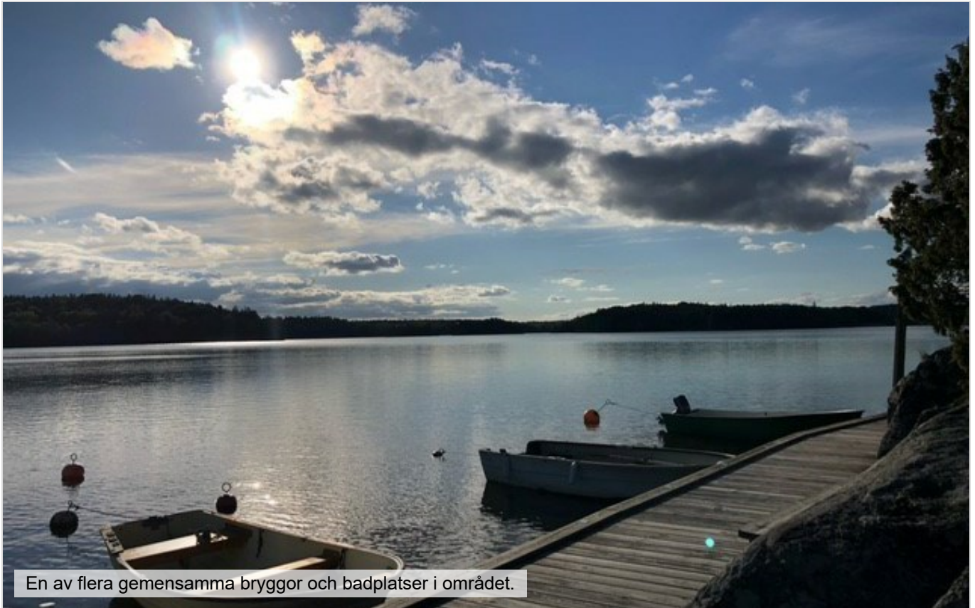
En av flera gemensamma bryggor och badplatser i området.