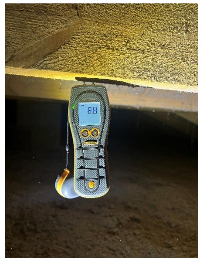
8,8% i takbjälke. "torrt"