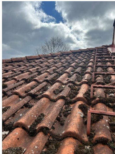
Mossa på yttertaket.