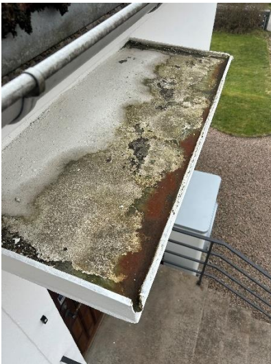
Ena entrétaket, rostskador förekommer även på de andra.