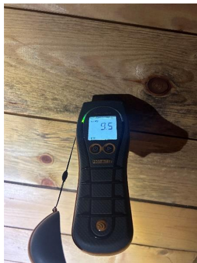
9,5% i underlagstaket "torrt"