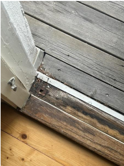
Rötskada tröskel till altandörr.