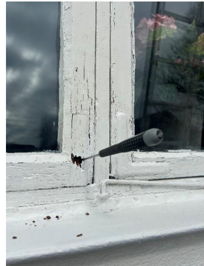
Rötskada i fönster till vardagsrum.