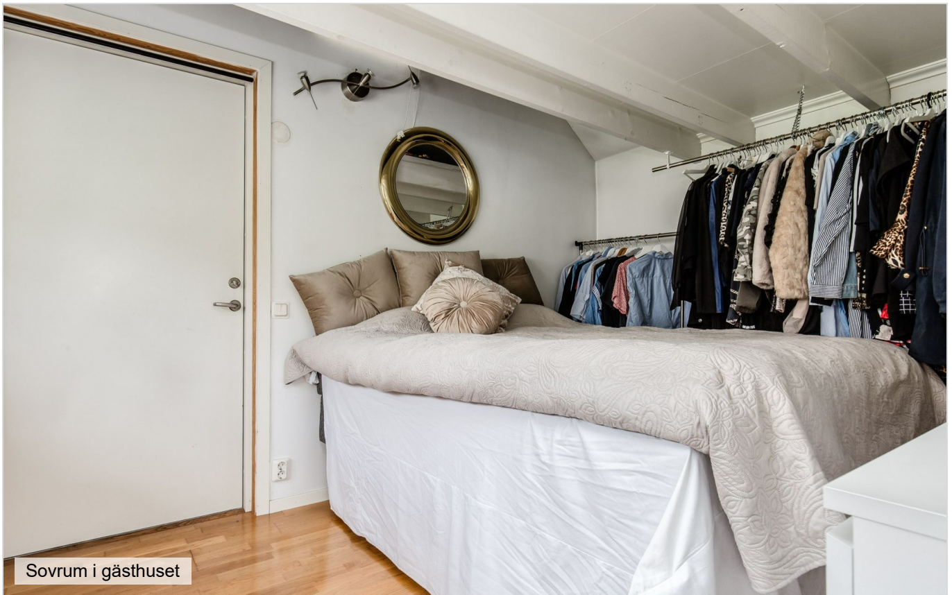
Sovrum i gästhuset