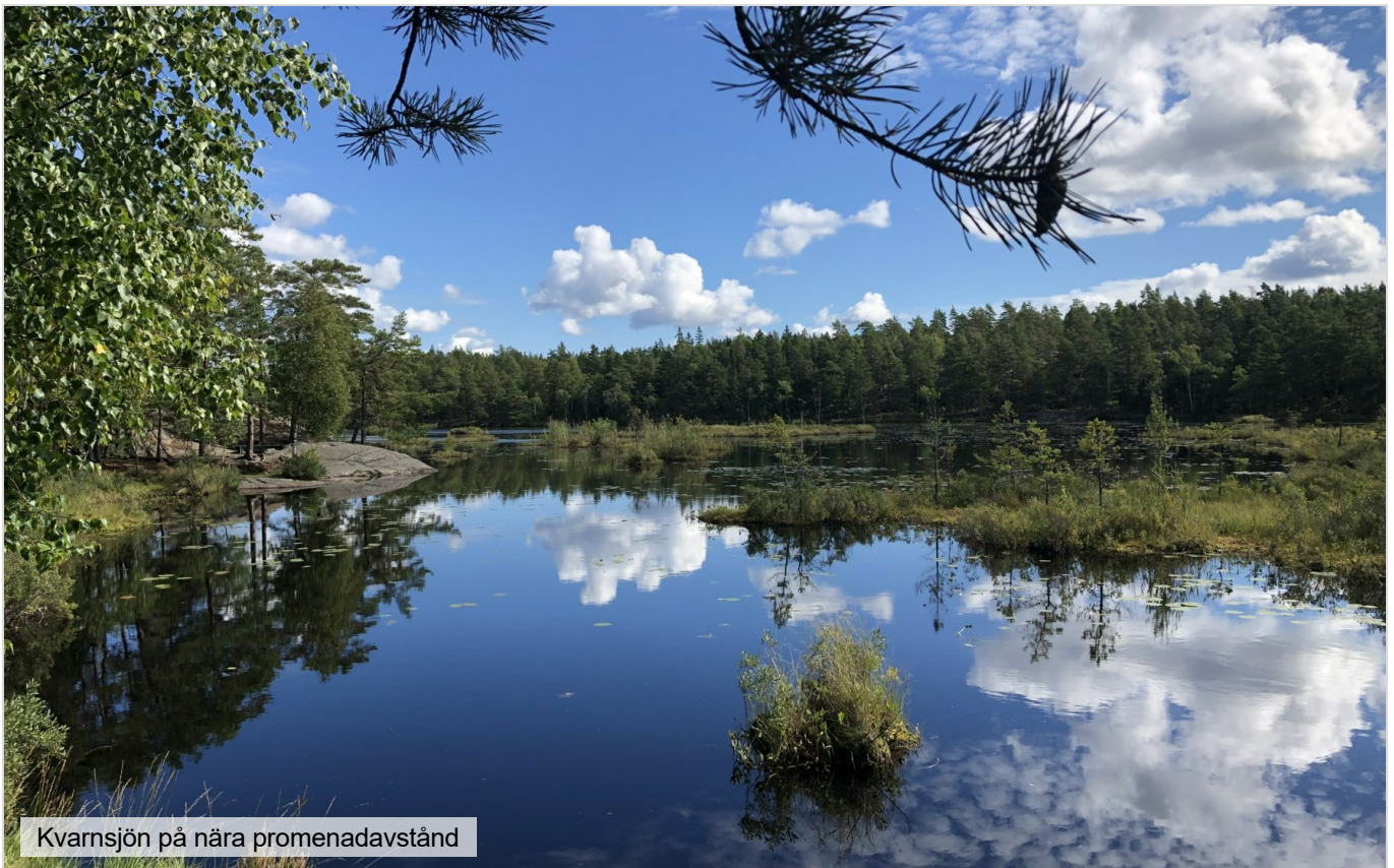
Kvarnsjön på nära promenadavstånd