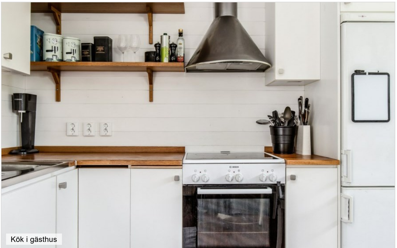
Kök i gästhus