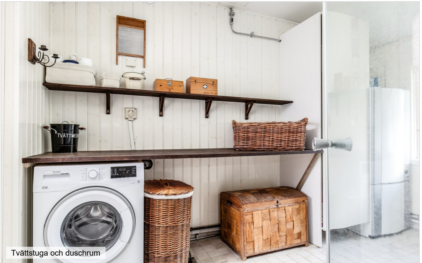
Tvättstuga och duschrum