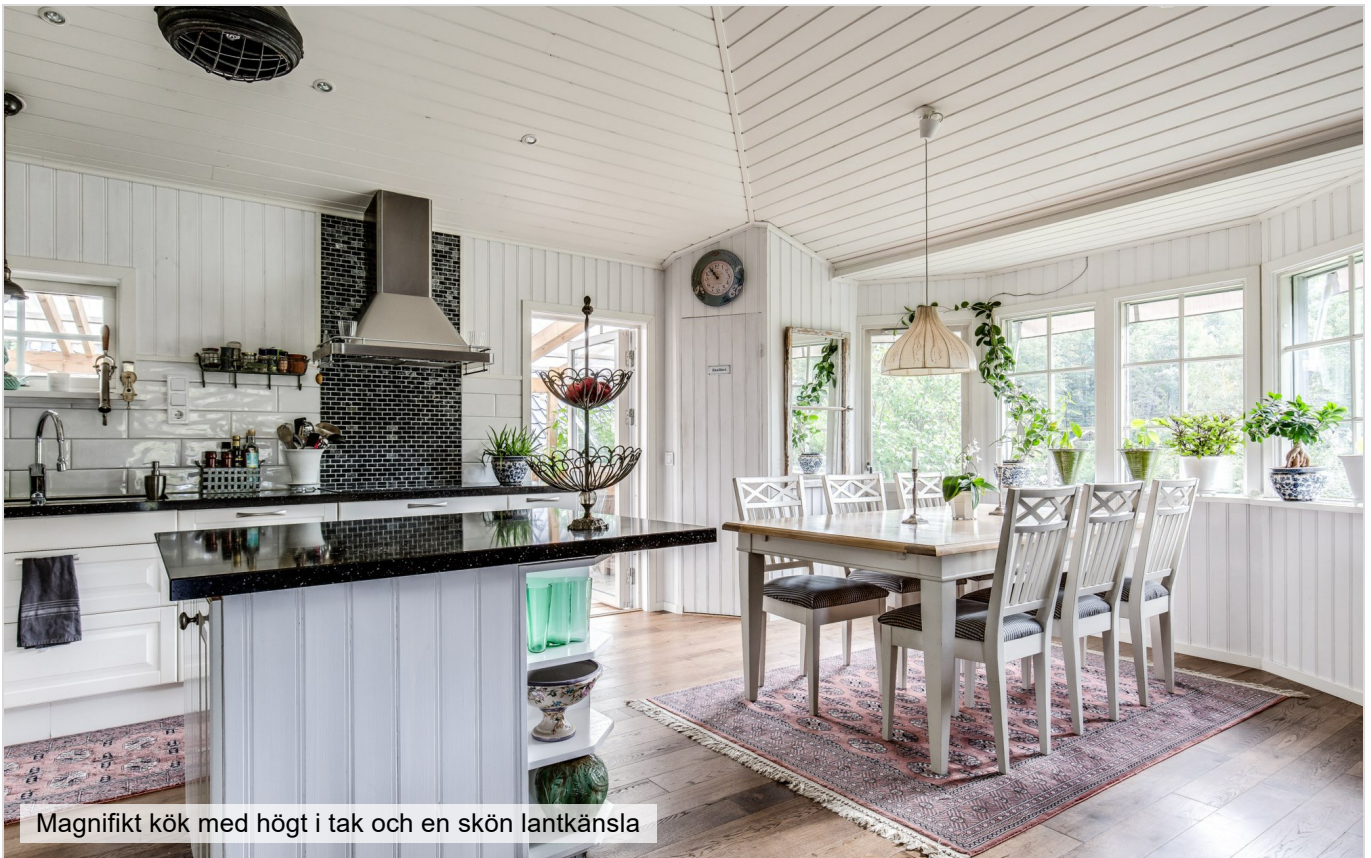
Magnifikt kök med högt i tak och en skön lantkänsla