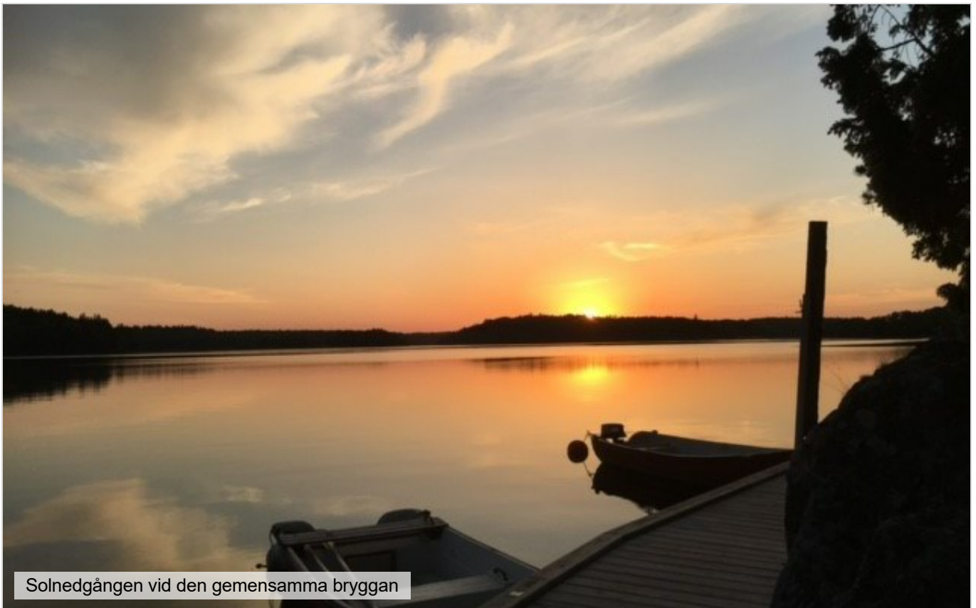
Solnedgången vid den gemensamma bryggan