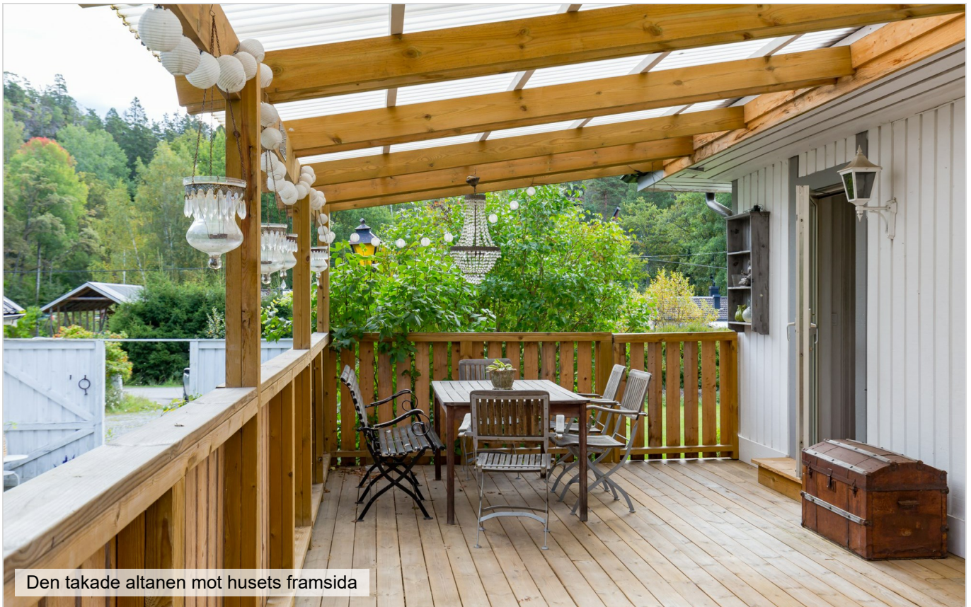
Den takade altanen mot husets framsida