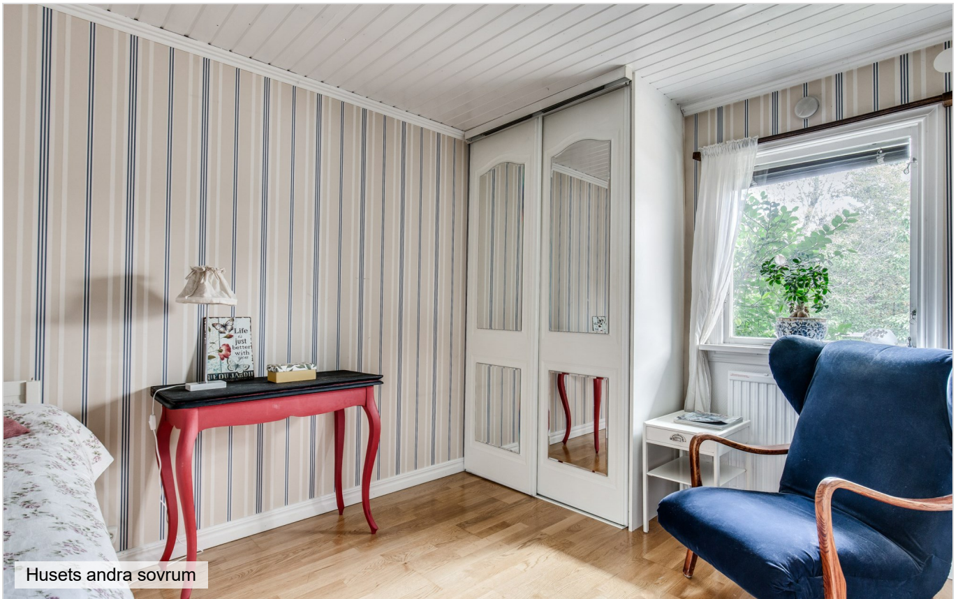
Husets andra sovrum