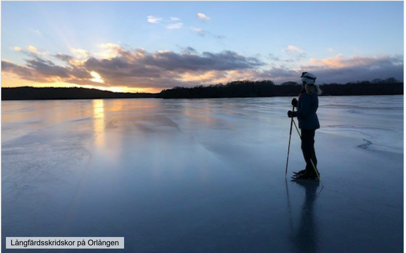
Långfärdsskridskor på Ornlängen