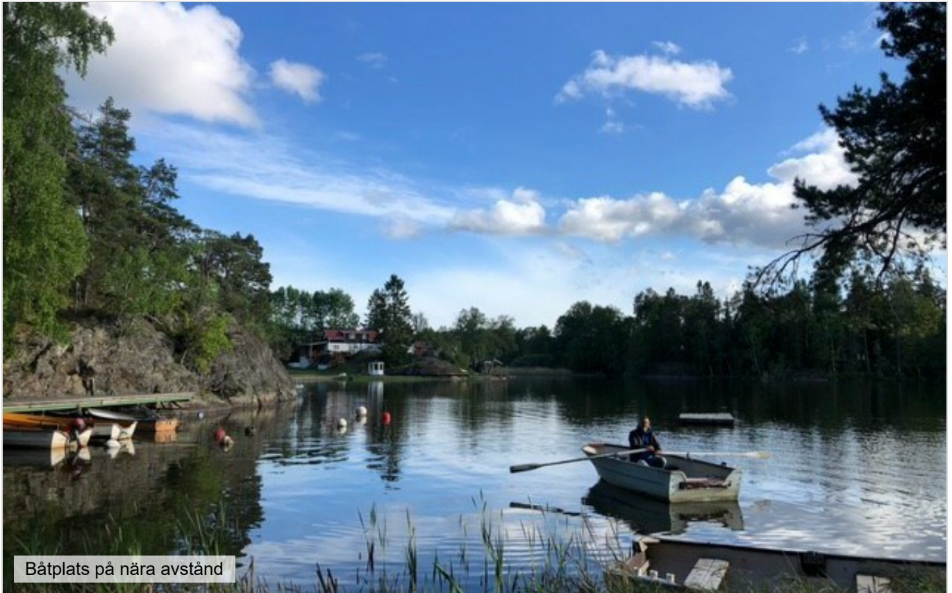
Båtplats på nära avstånd