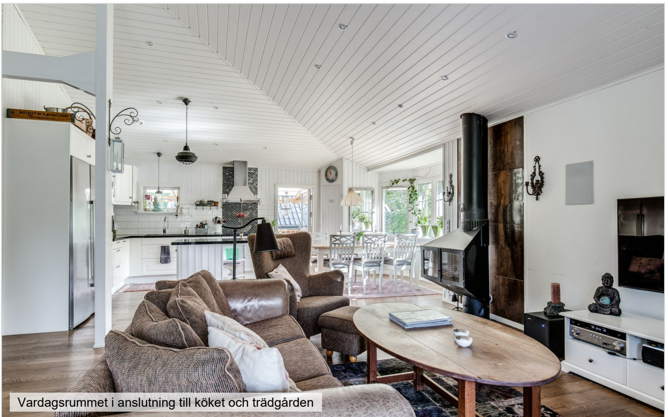
Vardagsrummet i anslutning till köket och trädgården