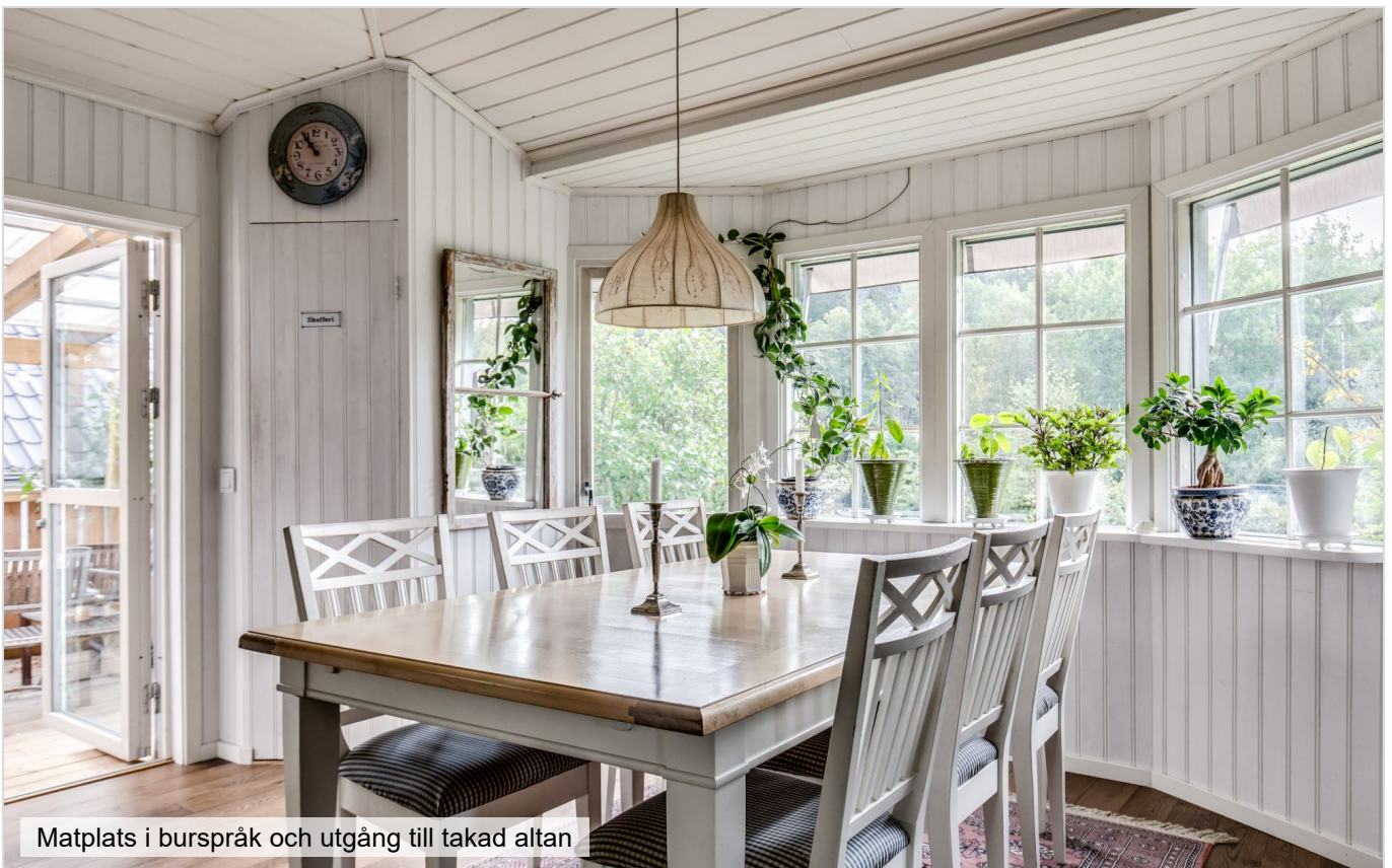
Matplats i burspråk och utgång till takad altan