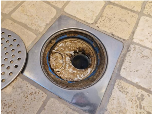
Brunnsmanschett sticker ut under klämring.