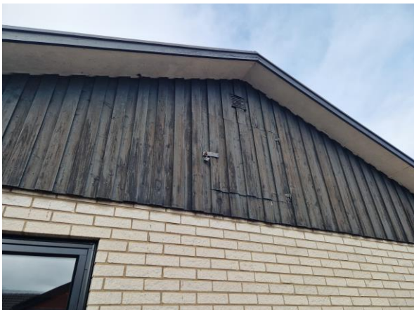
Underhållsbehov på träpanel.