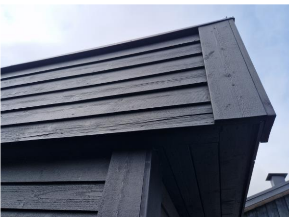
Sprickor i träpanel på garagebyggnad.