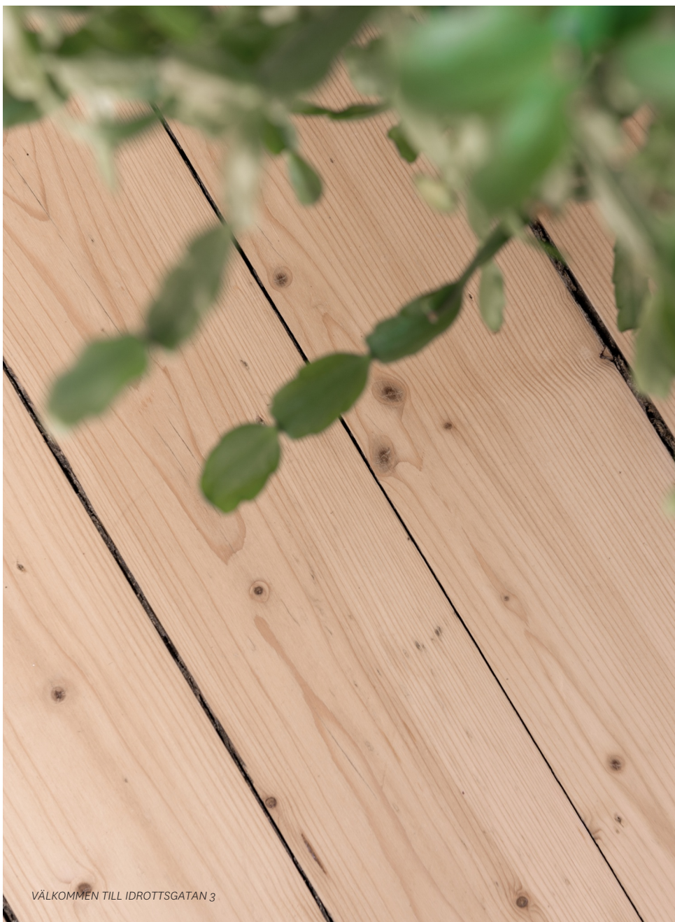
VÄLKOMMEN TILL IDROTTSGATAN 3

Välkommen till denna mysiga förening på visning!