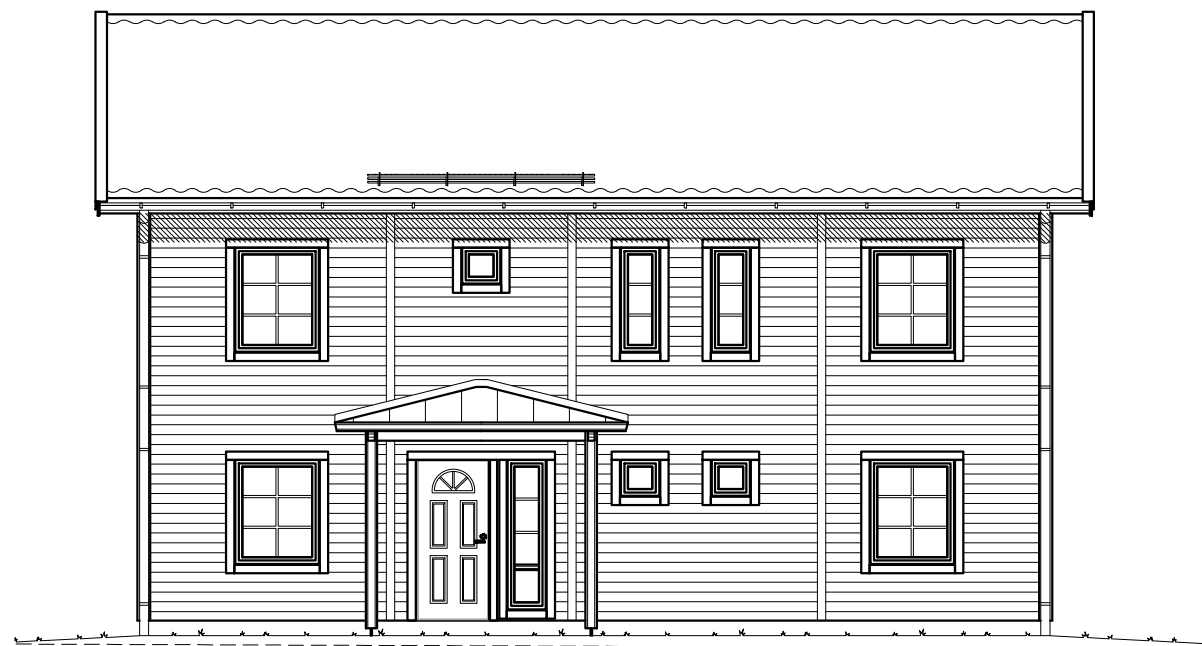
FASAD MOT SYDÖST