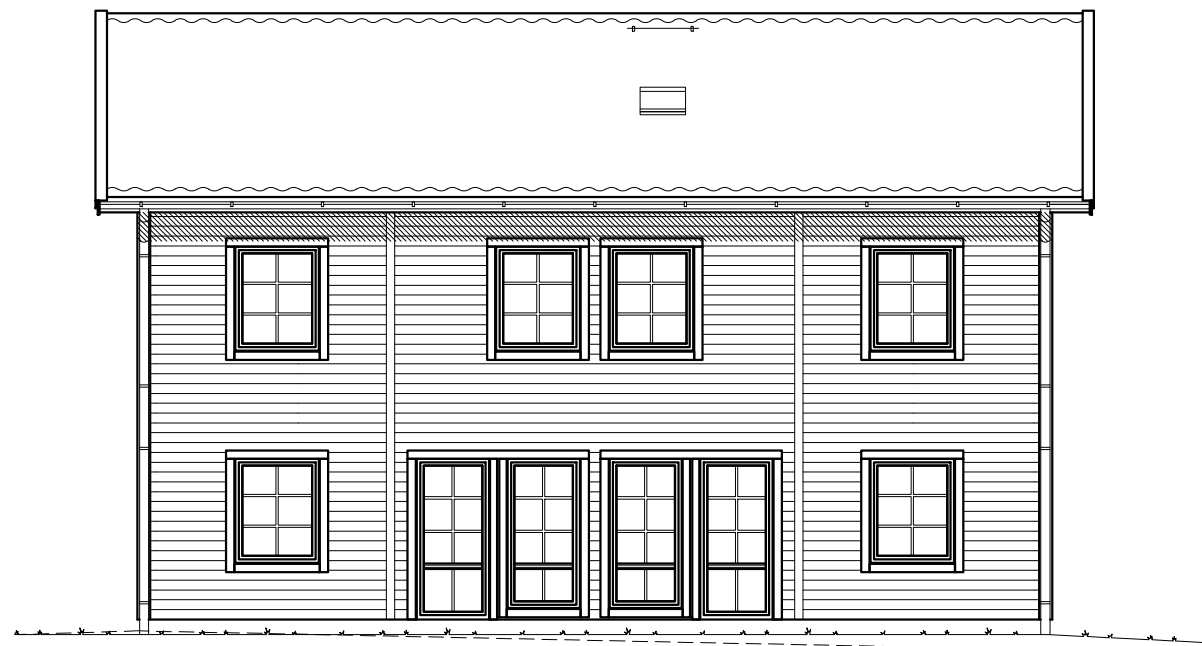
FASAD MOT NORDVÄST