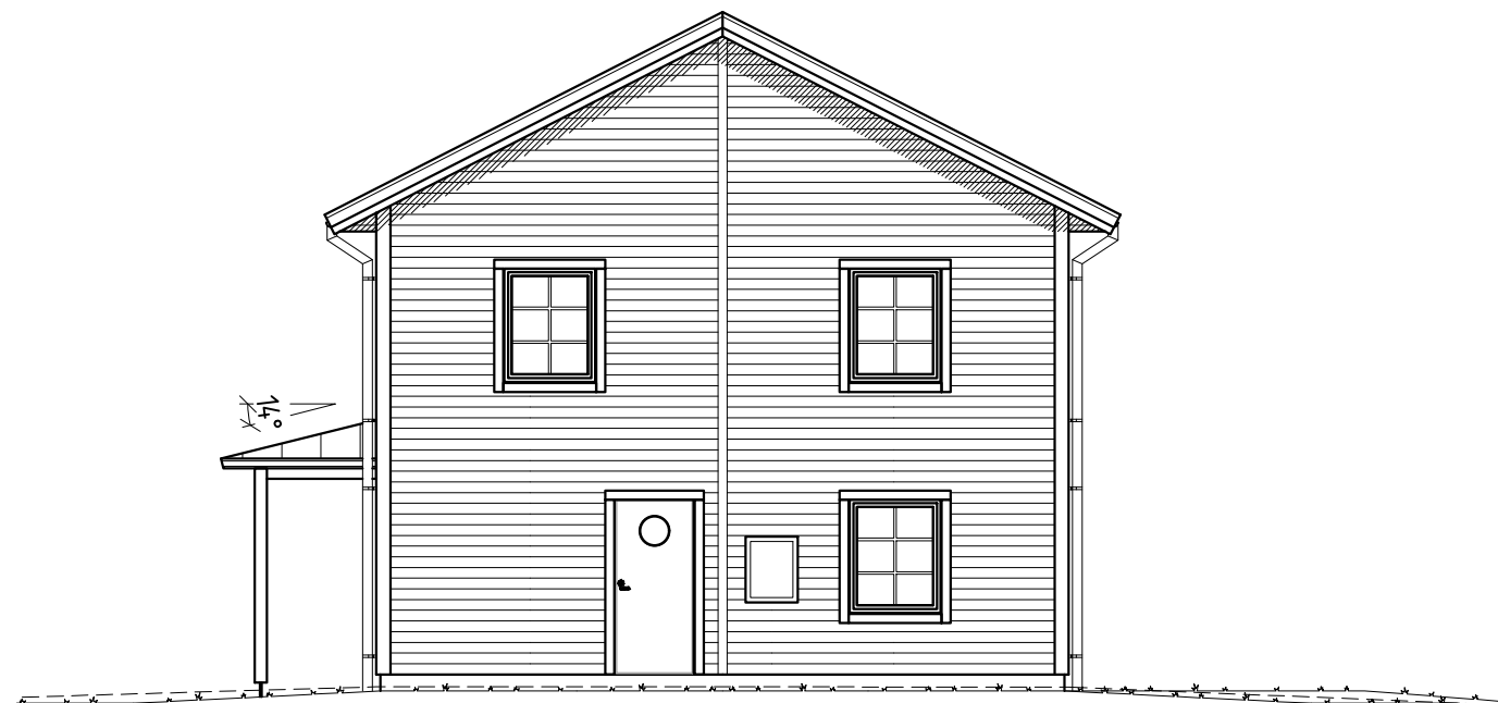
FASAD MOT NORDÖST