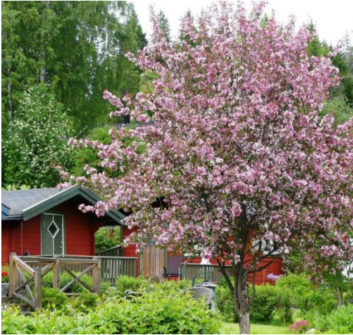
Rosenapel i Dalkarlsleden