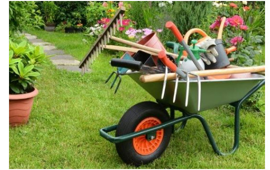
Tillsammans skapar vi en miljö där alla kan trivas

Från början arrenderade föreningen mark av kommunen, men 2001 fick föreningen köpa marken.