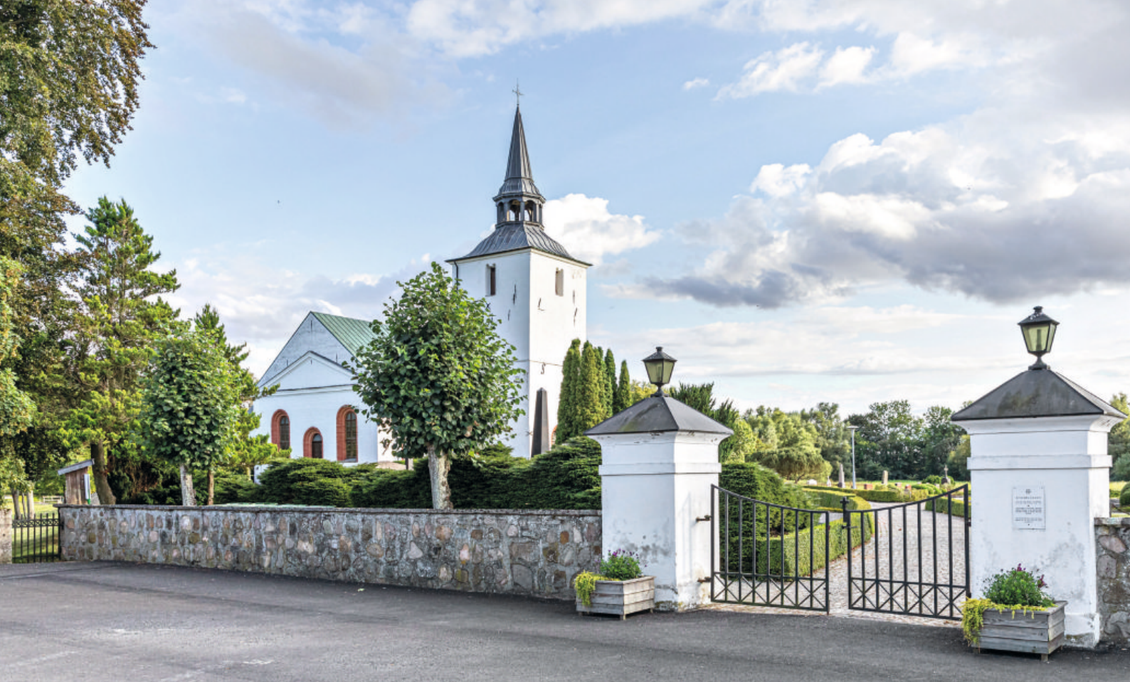
OVAN. MARIEHOLMS VACKRA KYRKA. NEDAN. HÄR BOR DU FAMILJEVÄNLIGT MED NÄRHET TILL NATUREN.