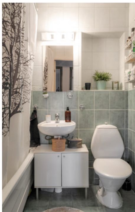
RINGVÄGEN 14 | Rumsbeskrivning